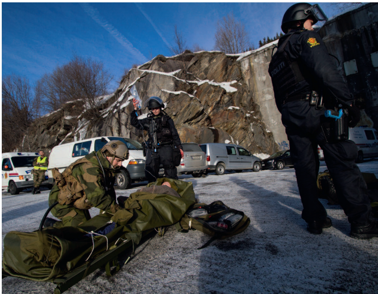
FHS samarbeider med blant andre Politihøgskolen om utvikling av nye studier og emner.

veksling til stabsskoler og læreinstitusjoner i Baltikum, Canada, Danmark, Frankrike, Nederland, Sverige, Storbritannia, Tyskland og USA.