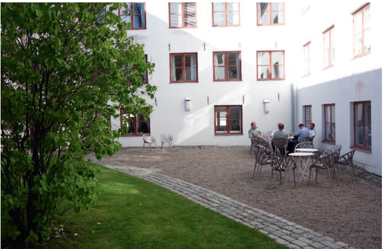
Bibliotekhagen brukes mye av både studenter og ansatte.