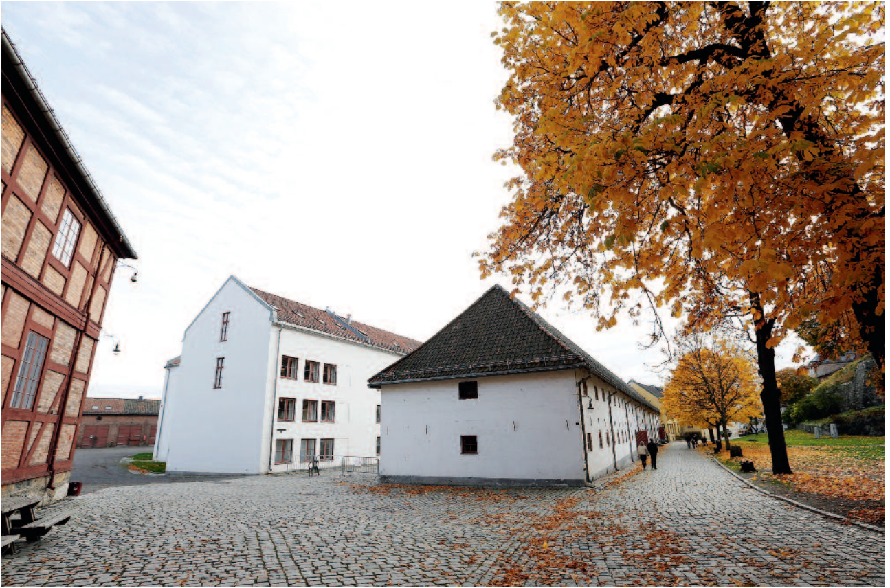
FHS holder til i vakre historiske omgivelser på Akershus festning.