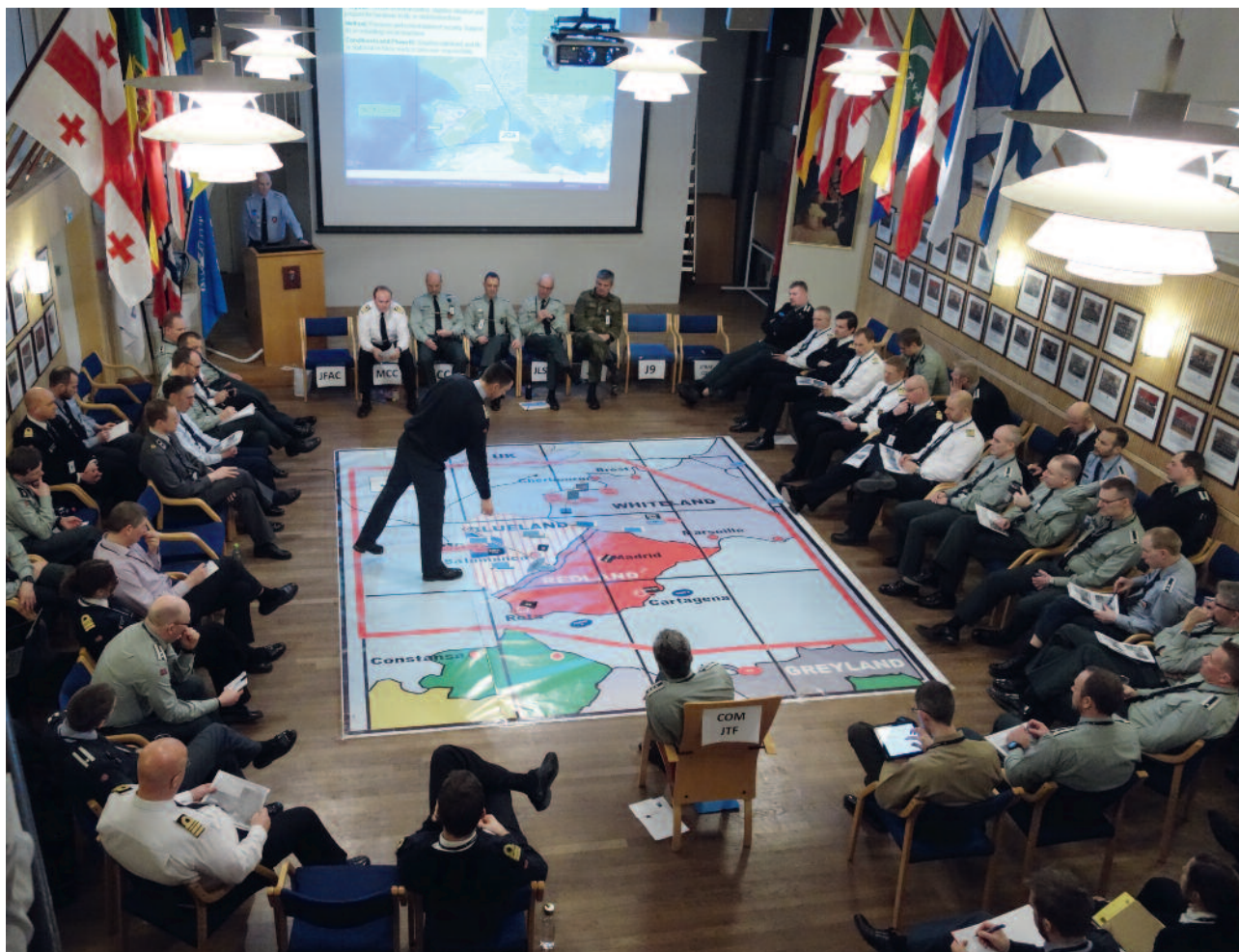
Forberedelser til øvelse Joint Effort, der studentene får prøvd kunnskapene i gjennomføring av fellesoperasjoner.

debatter om forsvars- og sikkerhetspolitikk i ulike kanaler.