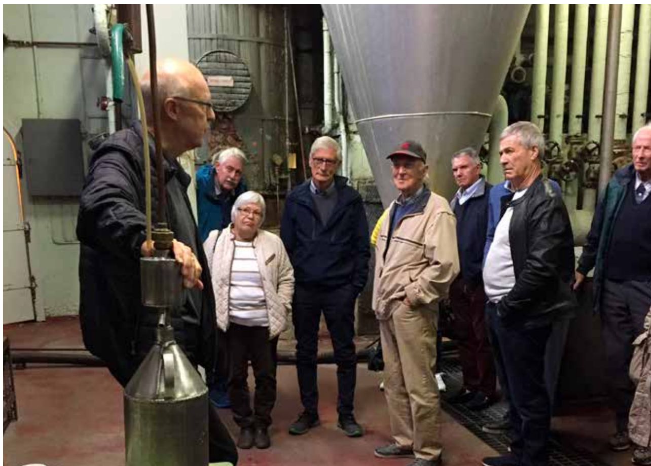
FSF avd. Lillehammer for en omvisning på Løtens gamle brenneri.