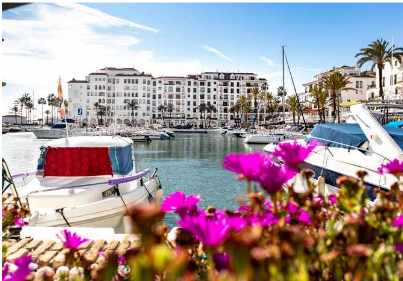
Marinaen i Duquesa.

aktivitet og sosial interaksjon, sier Frestad.