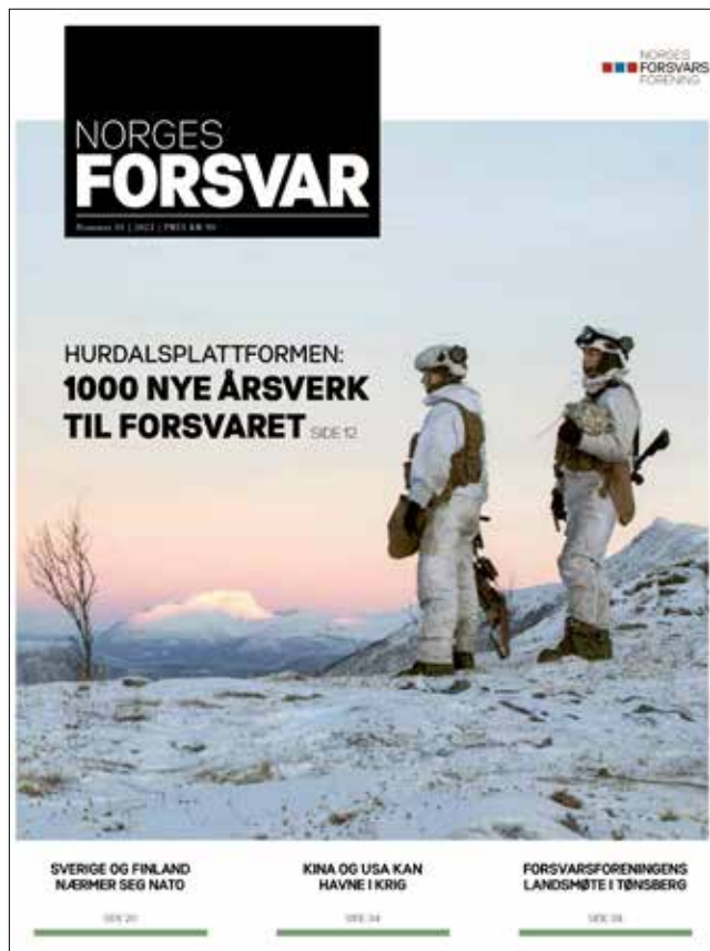
Norges Forsvar nr. 5, 2021

NFF sentralt jobber målrettet mot politikere på Stortinget og de enkelte partigrupper for å påvirke i Forsvars- og sikkerhetspolitikken. Vi ønsker å være en støttespiller til forsvarsledelsen og bygge oppunder det som Forsvaret forsøker å få til. Samtidig jobber vi for et sterkt forsvar, slik at NFFs oppgave også er å peke på svakheter og utfordringer, både overfor forsvarsledelse, regjeringen og våre politikere.