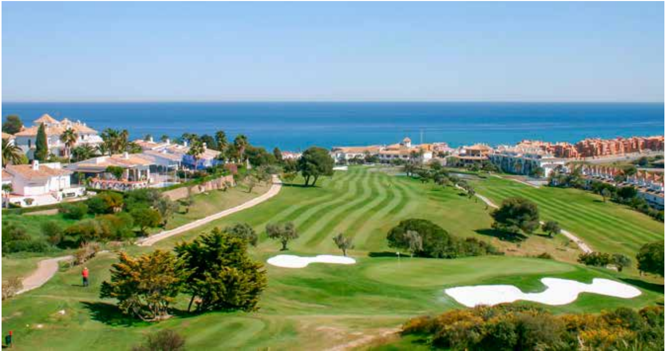
La Duquesa Golf.

liedepartementet. Dette samsvarer med hva Ambera står for, forteller Sylvia Brustad.