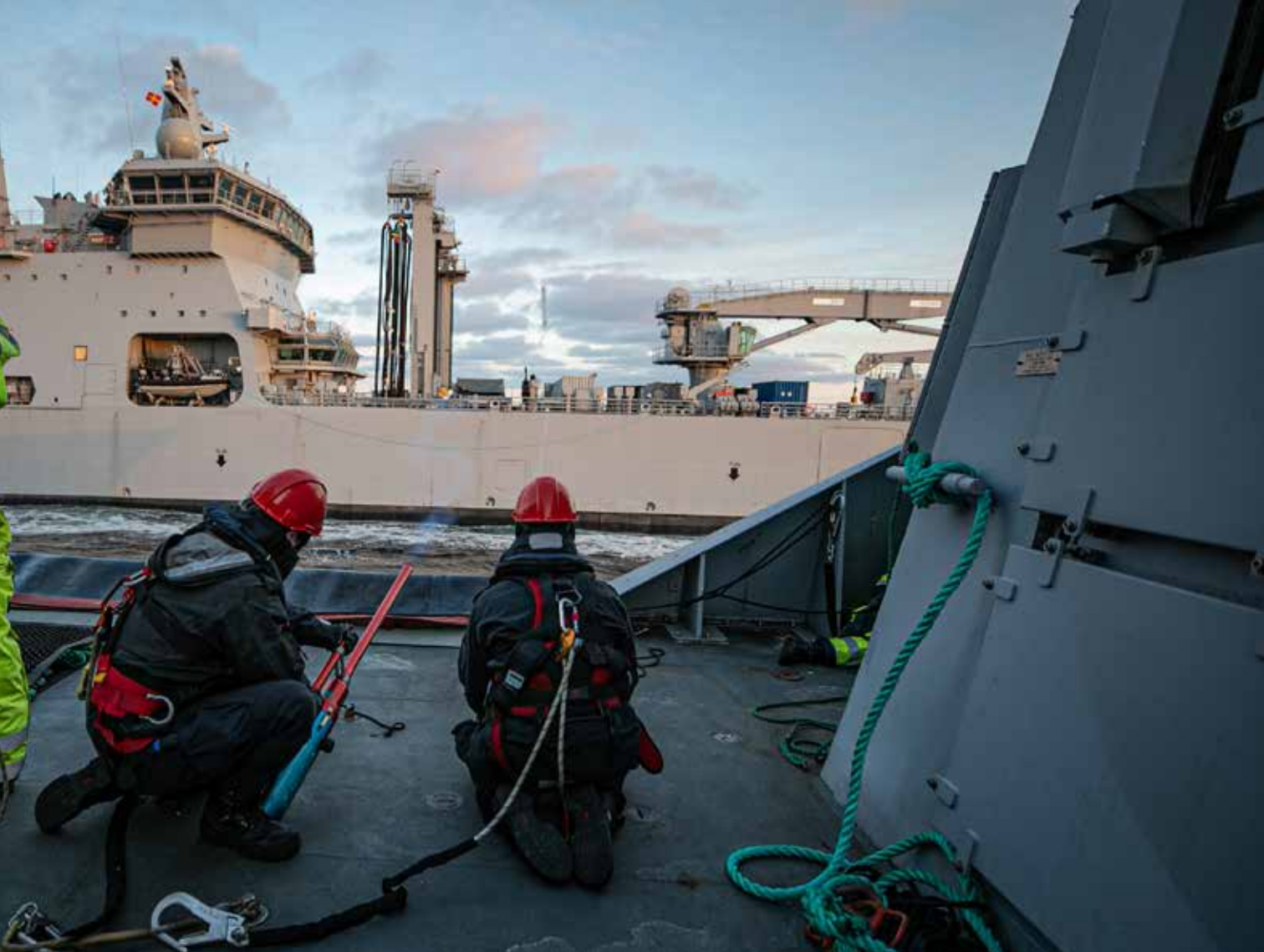
KNM Maud støtter fregatten KNM Heyerdahl med etterforsyning av drivstoff - RAS (Replenishment at Sea). Under øvelsen TG 21-2 i Nord-Norge.

sert på Sortland, med en operasjonsentral som er bemannet 24/7/365. Operasjonsavdelingen leder daglig kystvaktoperasjoner i hele Norges havområde. Kystvaktens flåte består av totalt 15 fartøy, fordelt mellom de større havgående fartøyene i ytre kystvakt og de mindre fartøyene i indre kystvakt.