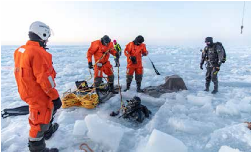
Dykkere under CAATEX 2020 i Beauforthavet.

tifiseringsløpet av Marinens fregatter med dens besetninger. Opptreningen og sertifiseringen i FOST innebar i perioder at inntil 60 britiske og utenlandske instruktører var om bord for opplæring og kontroll av ferdigheter. Til tross for en omfattende smittesituasjon i Storbritannia under gjennomføringen, ble FOST fullført uten smitteutbrudd i besetningen.