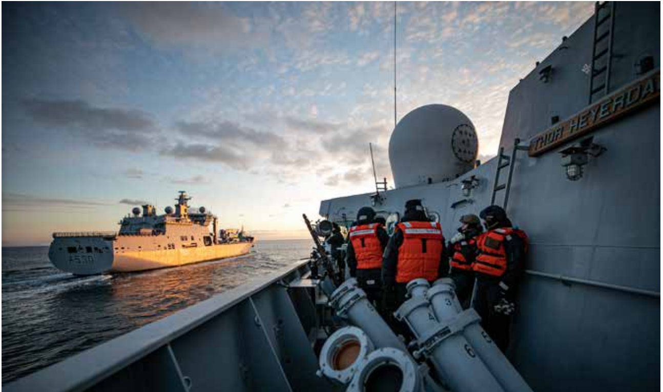
KNM Maud støtter fregatten KNM Heyerdahl med etterforsyning av drivstoff - RAS (Replenishment at Sea). Under øvelsen TG 21-2 i Nord-Norge.

løsninger for vedlikehold, trening og utdanning. Dette gir retning for hvordan anskaffelser av avanserte systemer kan gjøres i fremtiden. Norges fire nye 212CD ubåter forventes levert i perioden 2030-2036.