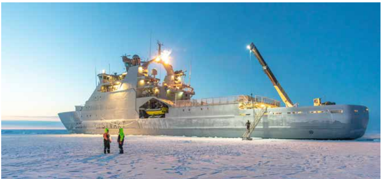
KV Svalbard i Beauforthavet utenfor Alaska, for å bistå med å ta opp viktige forskningsrigger.

Etter Russlands annektering på Krim i 2014 har forholdet mellom det vestlige NATO og Russland kjølnet. Annekteringen viste Russlands evne til hybrid krigføring. Dette ble gjennomført i gråsonen, med enhetlig bruk av samtlige av statens virkemid-