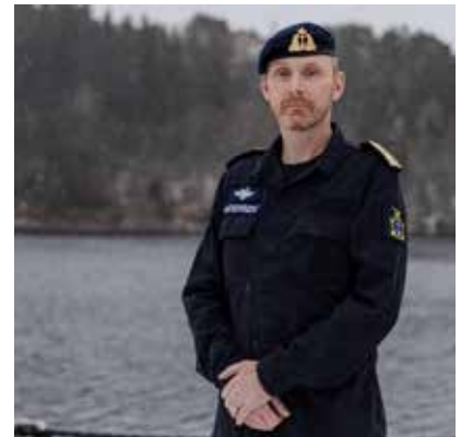
Sjøforsvaret Kontreadmiral Rune Andersen.

Nye investeringer, modernisering og utvikling viser at Norge tydelig prioriterer å følge den kontinuerlige teknologiske utviklingen, i den hensikt å sikre en troverdig relevans i Forsvaret av Norge innenfor rammen av NATO.