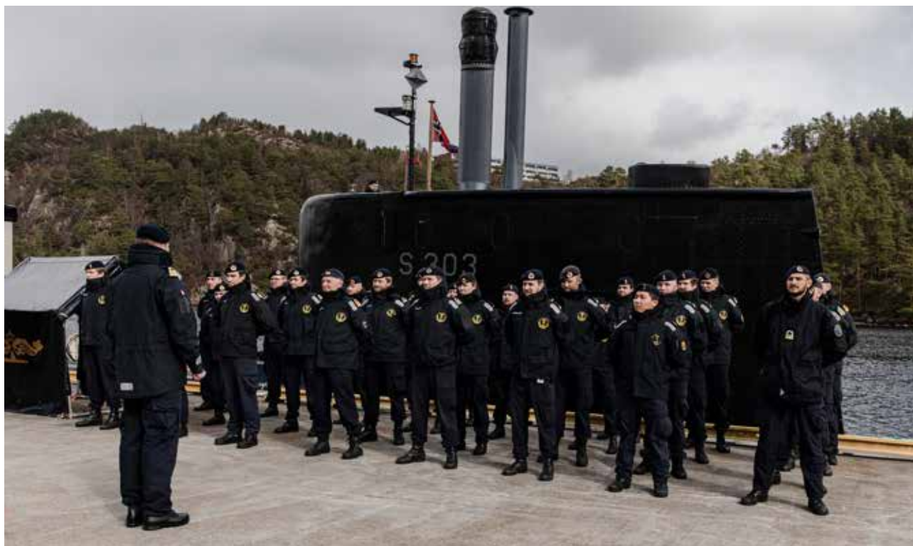
KNM Utværgår fra kai på Haakonsværn, for å operere i Nord-Norge i en periode.