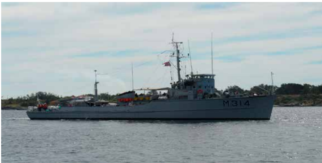
M314 Alta.

Medlemskontingenten er beskjedne 100 kr året i håp om at det av den grunn vil være aktuelt for mange å slutte opp om denne redningsaksjonen for M 314 Alta. Du kan melde deg som medlem via hjemmesiden www.m314alta.org . «Fair winds and following seas» ønskes deg fra styret i venneforeningen, – de håper på å få mange av oss som medlemmer. Ta kontakt om du har spørsmål.