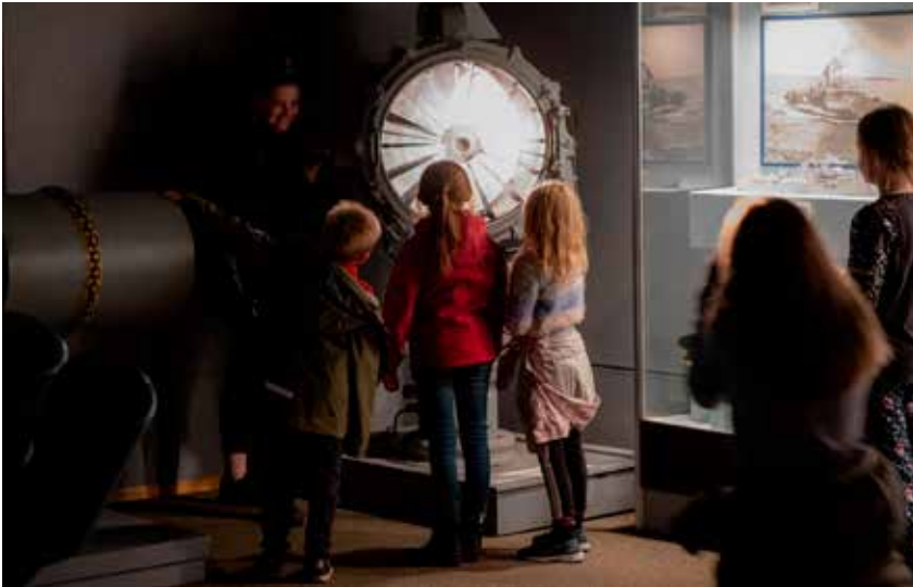
Det er et hav av grunner til å besøke et museum, og alle trenger ikke å være så opplysende som dette FOTO: HÅVARD MADSBAKKEN/FORSVARETS MUSEER.

visningsmagasin som viser ildledningssystemer som har blitt benyttet av Kystartilleriet.