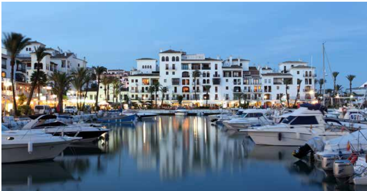
Marinaen i Duquesa.