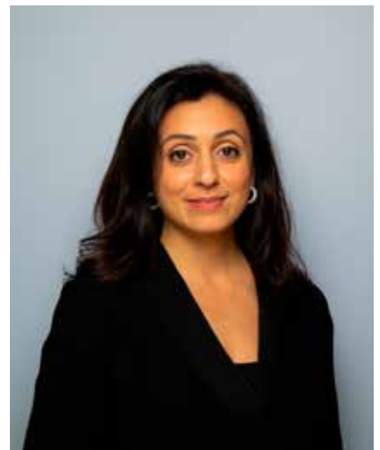
Statsråd Hadia Tajik

Statsråden avsluttet møtet med å si at hun ønsket et godt samarbeide med seniororganisasjonene i fremtiden, slik at vi alle kan ha innflytelse på utarbeidelse av de årlige statsbudsjetter.