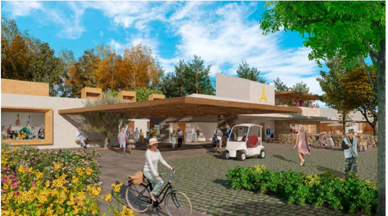
Aktivitetssenter Ambera. ILLUSTRASJON: AMBERA.COM

helt bestemt meg ennå i hvilket Ambera-prosjekt jeg skal kjøpe min bolig, men det blir garantert i Spania, sier han.