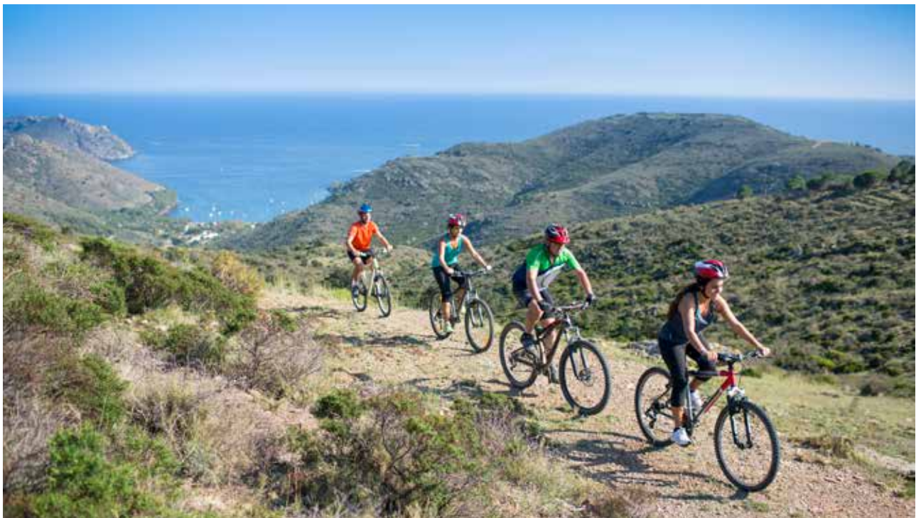
Sykkeltur i fjellene.

Forsvarets Seniorforbund er partner med Ambera. Dette innebærer blant annet at dersom medlemmer av Forsvarets Seniorforbund på sikt kjøper en bolig i Ambera, gir Ambera en prosentvis provisjon tilbake til forbundets viktige arbeid for å skape gode aktivitetstilbud for Forsvarets seniorer.