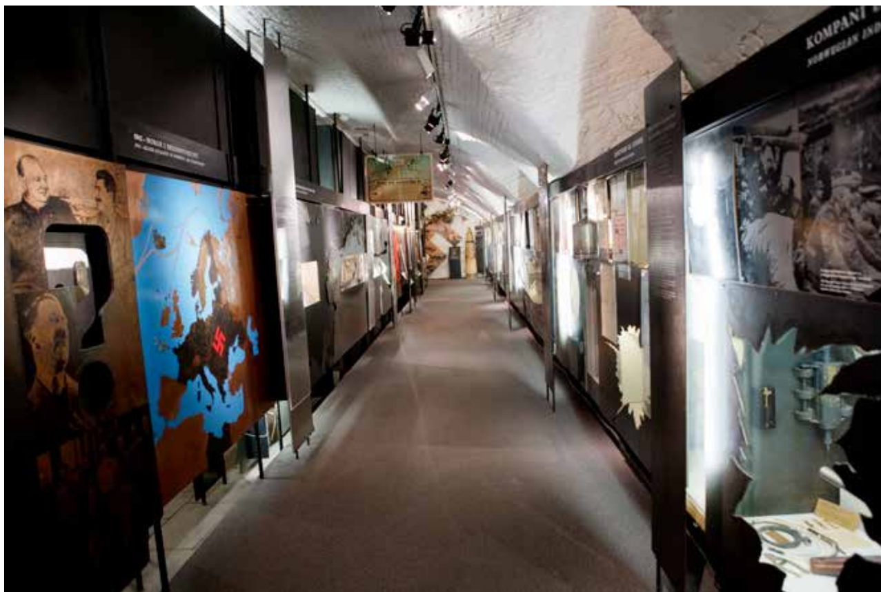
Norges Hjemmefrontmuseums utstilling er ikke bare et vitnesbyrd om motstandskamp og krigen i Norge, men også om hvordan historien om krigen i Norge har blitt fortalt.

et studiemagasin og modellkammer, forbeholdt ulike typer fagfolk. Åpent for allmennheten ble det ikke før i 1978.