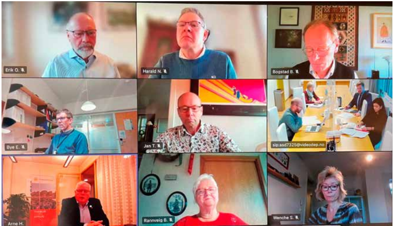
Digitalt møte.

for store utgifter for forbrukerne, og enorme inntekter for Staten. Det mener FSF er feil.