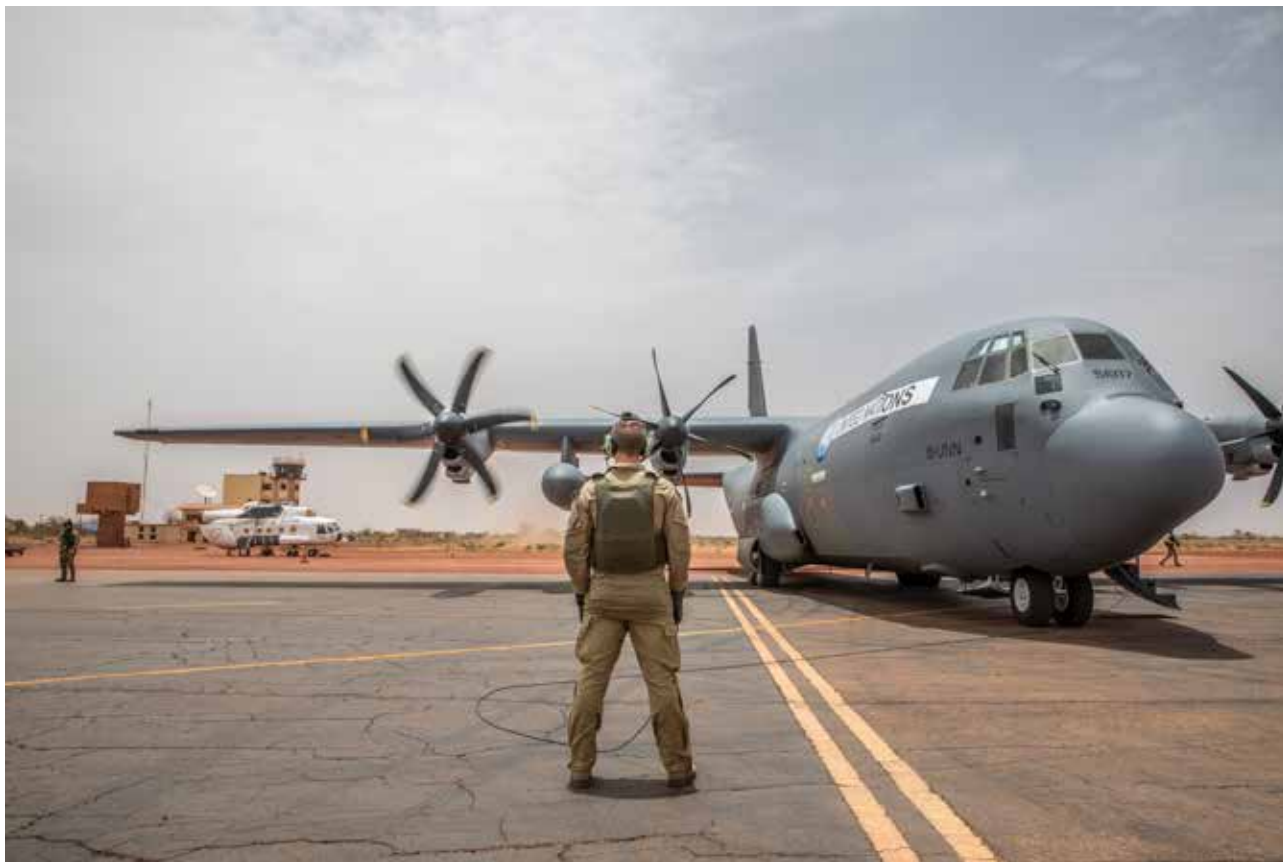
Et C-130J Hercules transportfly i Mali.

nal kontraterror, men for å kunne løse alle oppdragene fullt ut i krise og krig, er vi avhengig av et nytt helikopter som er bedre tilpasset trusselbildet og operasjonsmønsteret til spesialstyrkene. I Regjeringen sitt forslag til LTP legges det opp til å starte arbeidet med å erstatte Bell fra 2024.