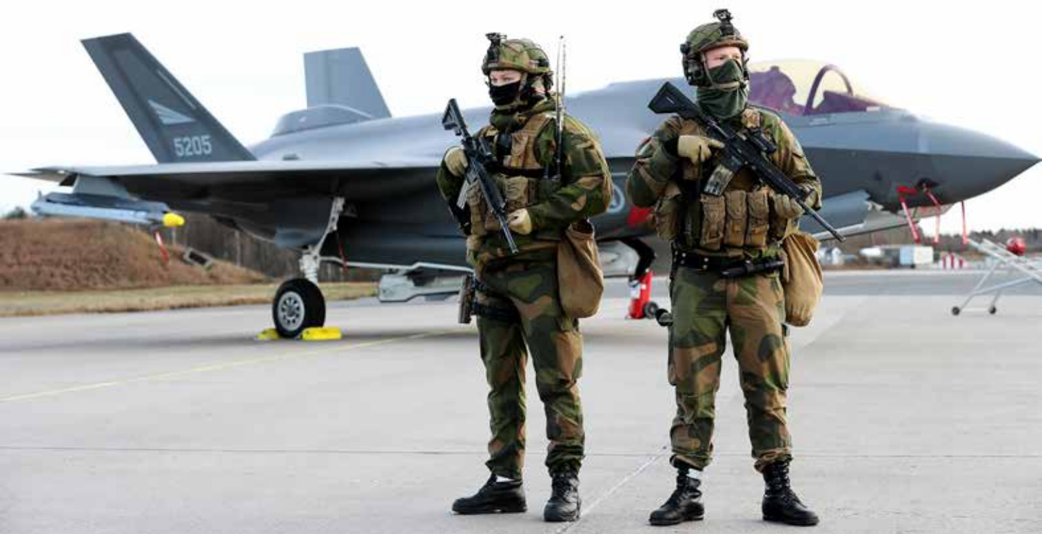
Soldater fra Force Protection vokter et F-35 på Luftforsvarets base Rygge under IOC-markeringen november 2019.