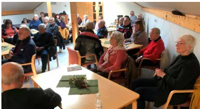
Bra fremmøte til medlemsmøte på Ørland.

en fremtidsfullmakt som ved et testamente og opprettelsen av en fremtidsfullmakt må selsvagt gjøres mens en er åndsfrisk. Mal for opprettelse av en fremtidsfullmakt finner du på vår hjemmeside