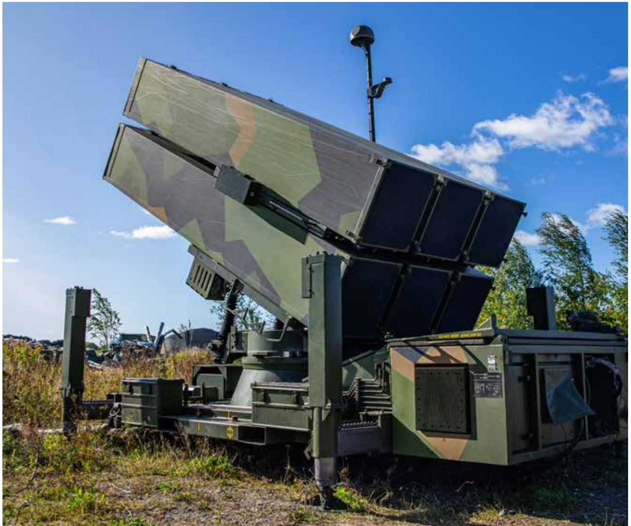
Luftvern fra Ørland har med seg det bakkebaserte luftvernsystemet NASAMS III på øvelse Falcon Response på Luftforsvarets base Rygge, i september 2020.

Langtidsplanen for Forsvaret legger vekt på bedret evne til både baseforsvar og luftvern. Det er positivt, men det legges opp til en senere innfasing og en lavere satsning på luftvern enn anbefalt av Forsvarssjefen. Dette vil medføre at Forsvaret på kort og mellomlang sikt vil ha mangelfull beskyttelse mot trusler fra langtrekkende presisjonsild.