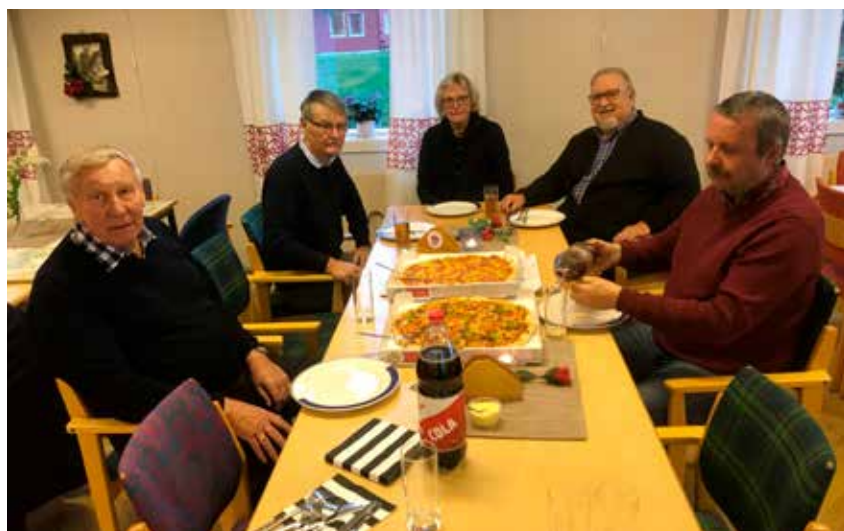
Litt mat og drikke ble det tid til også.

Jeg takker FSF Værnes og Ørland for meget godt opplegg og gjennomføring.