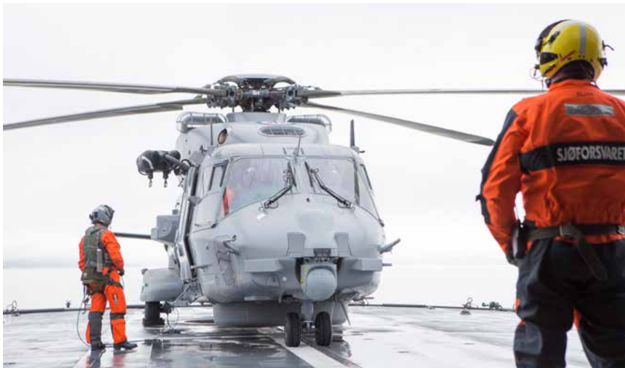
NH90 helikopter står på dekk på KV Senja under øvelse Nord.