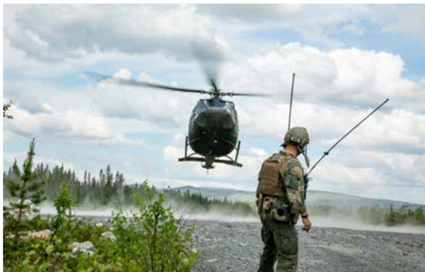
Bell 412 i støtte til Hæren.