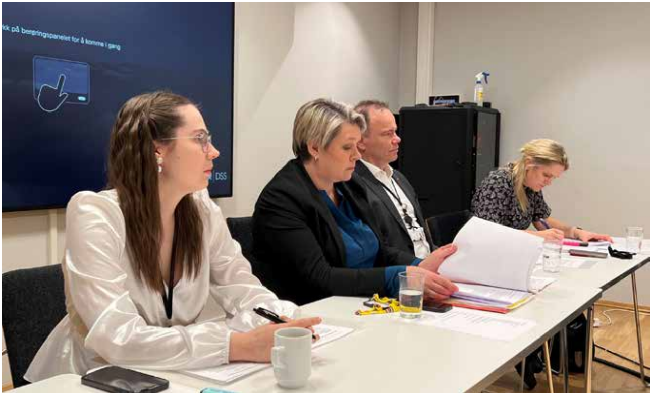
Arbeidsminister Marte Mjøs Persen (imidlertid) informerer om statsbudsjettet for 2024