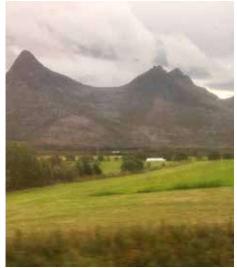
Noen av de 7 søstre.