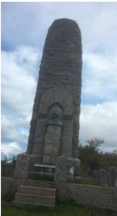
Ingen vet hvor Petter Dass ligger begravet på Alstadhaug, men bautaen over han er svært synlig.