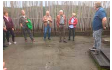
Informasjon på taket av Hamsund museet.