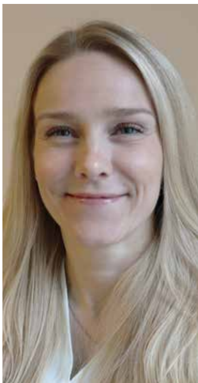
Av Stine Børset.

Som pensjonsmottaker i Statens pensjonskasse, er det ulike ting man må være klar over, avhengig av din individuelle situasjon. Målet med denne artikkelen er å dekke noen vanlige scenarier, og at den skal kunne fungere som veileder for deg med offentlig tjenestepensjon.