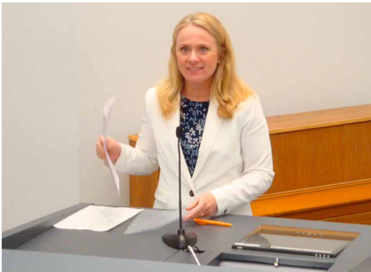
Statsråd Anniken Hauglie orienterte om resultatet etter tryggedrøftingene.