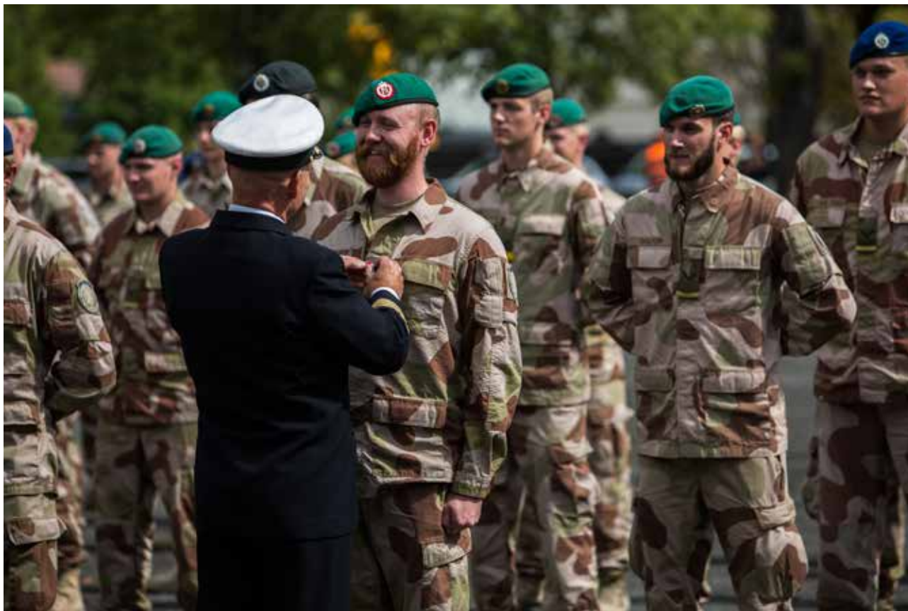
Hjemkomst med medaljesermoni for NOR TU, Irak i 2016.

å innstille noen til noen av medaljene som trenger rådsbehandling er det klokt å ikke informere den som innstilles til en medalje. Skulle en kandidat være kjent med at han eller hun er foreslått tildelt Krigskorset med sverd, skapes det fort en forventning hos vedkommende. Blir sluttresultatet derimot at kandidaten ikke når opp til å få en stridsdekorasjon i det hele tatt, blir fallhøyden stor og skuffelsen deretter. Oppfordringen blir derfor, ta hensyn og vis diskresjon ved, og ikke spre at du har innstilt en person til en dekorasjon.