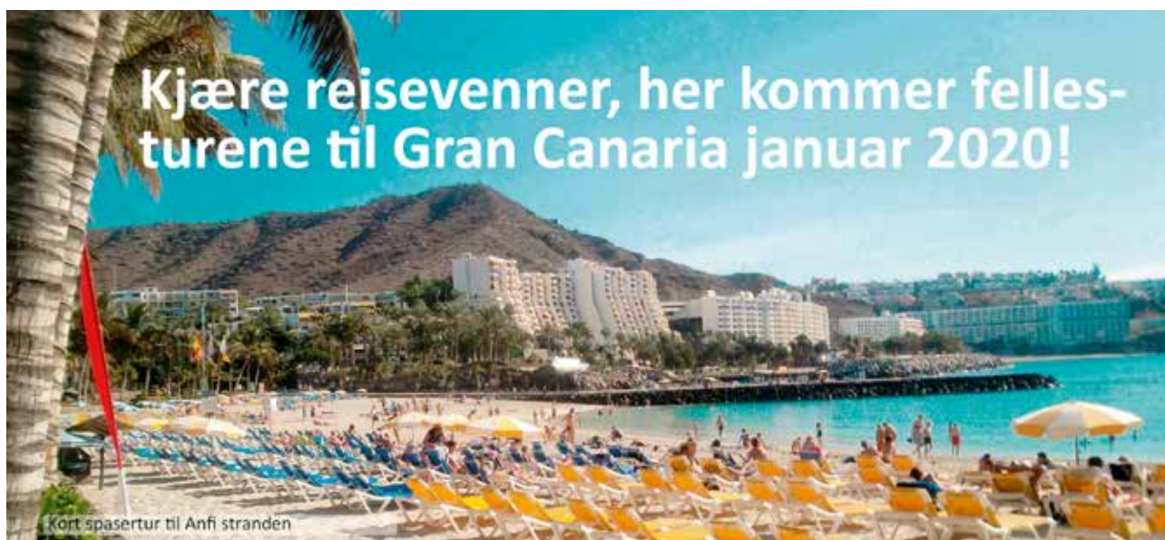
Kort spasertur til Anfi stranden