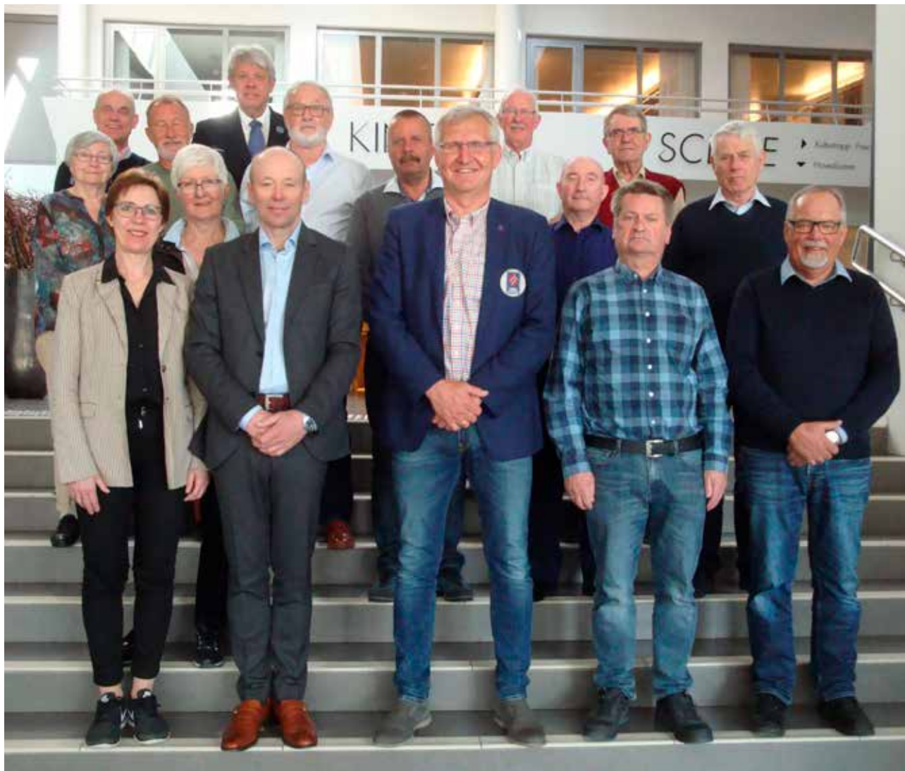
Forbundsstyret 2019 – 2021.