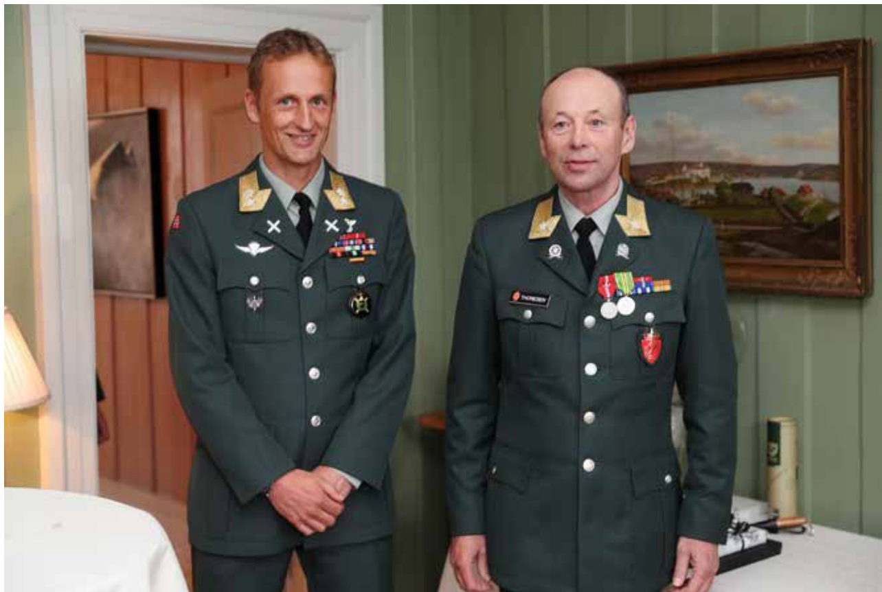
Brigader Thoresen overrakt Heimevernets fortjenstmedalje av sjef Heimevernet i 2019.

I 2010 ble St. Olavsmedaljen med ekegren og Krigsmedaljen gjenopptatt ved kongelig resolusjon. Etter andre verdenskrig er det tildelt 19 St. Olavsmedaljen med ekegren og 35 Krigsmedaljer.