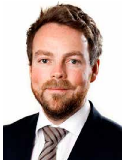
Statsråd Torbjørn Røed Isaksen ledet Trygdeoppgjøret på vegne av Regjeringen.

gjennom et langt yrkesaktivt liv. Det skal lønne seg å være i jobb.