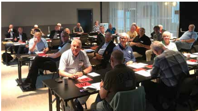
Deltagere på landsmøtet 2021 på Hamar.