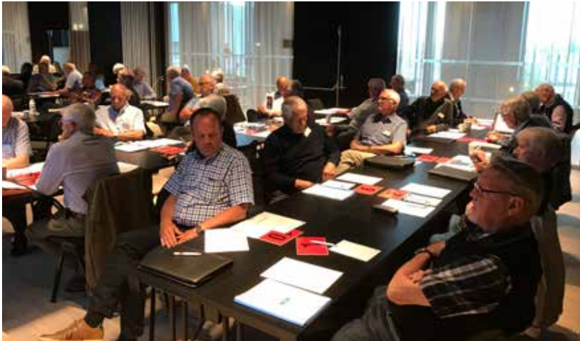
Deltagere på landsmøtet 2021 på Hamar.