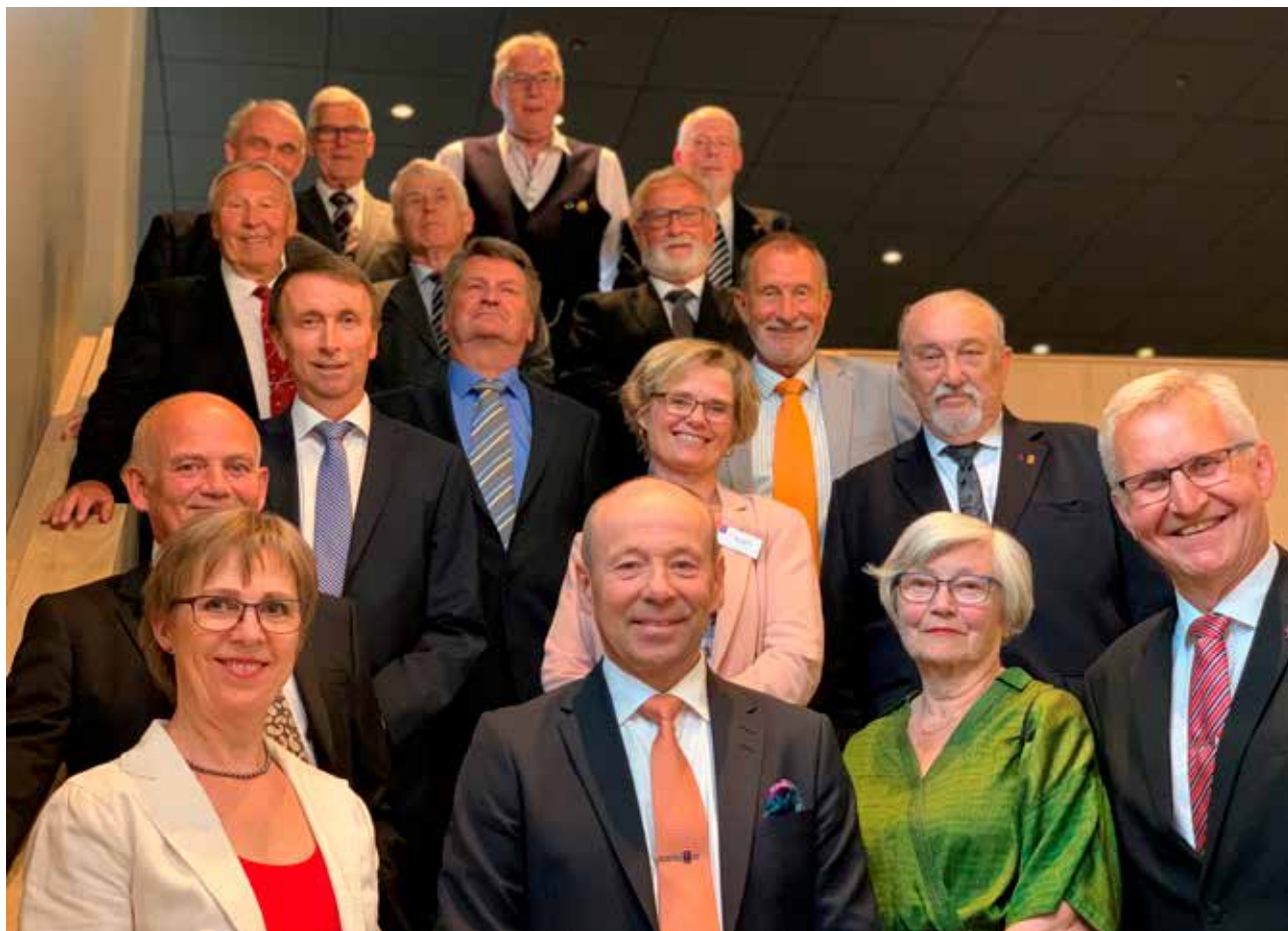
Det nyvalgte Forbundsstyret med vararepresentanter.