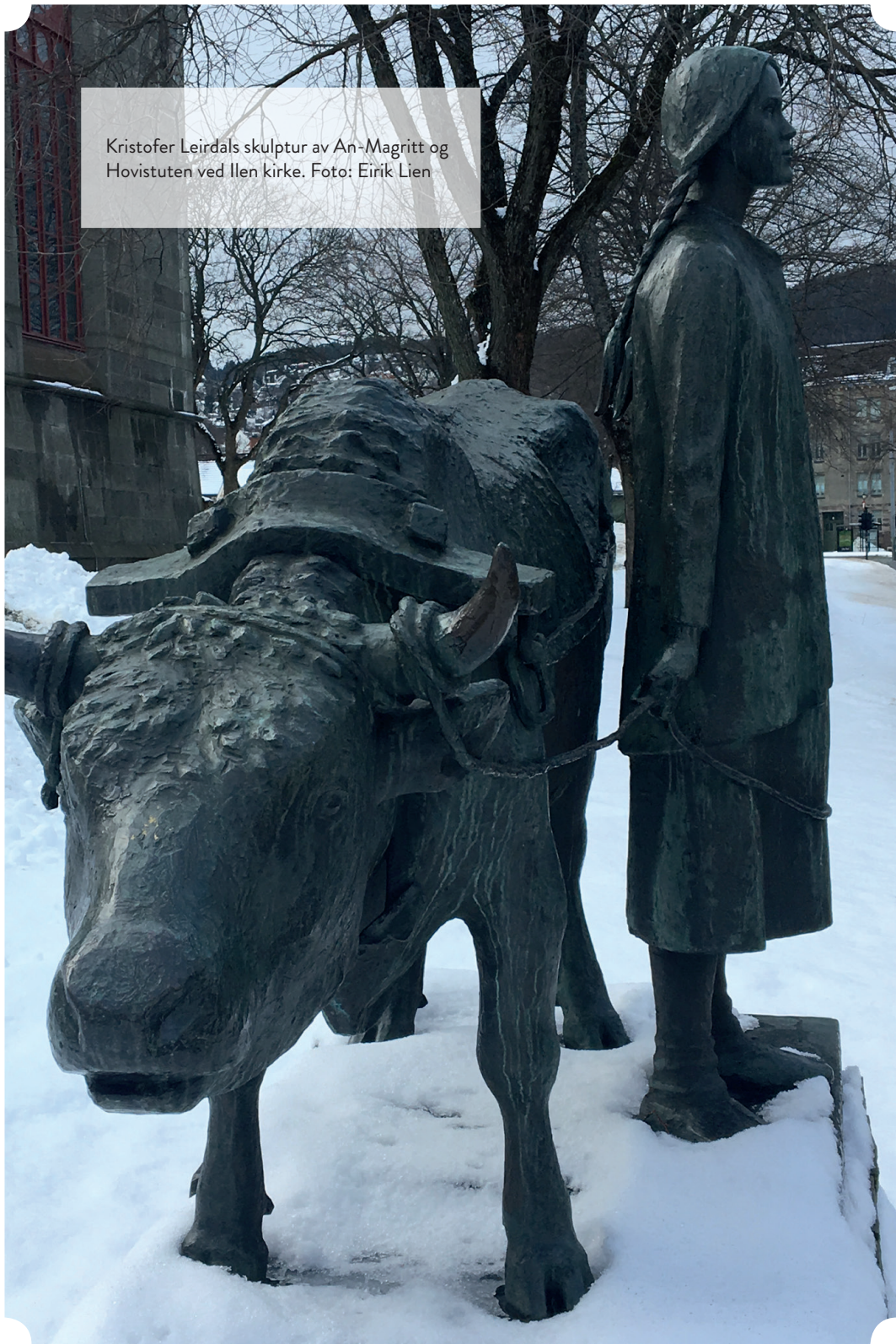
Kristofer Leirdals skulptur av An-Magritt og Hovistuten ved Ilen kirke.