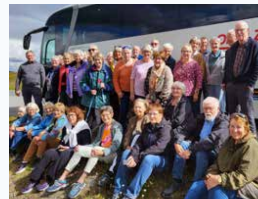
En glad gjeng fikk med seg årets kritikerroste utgave av «Elden» på Røros.