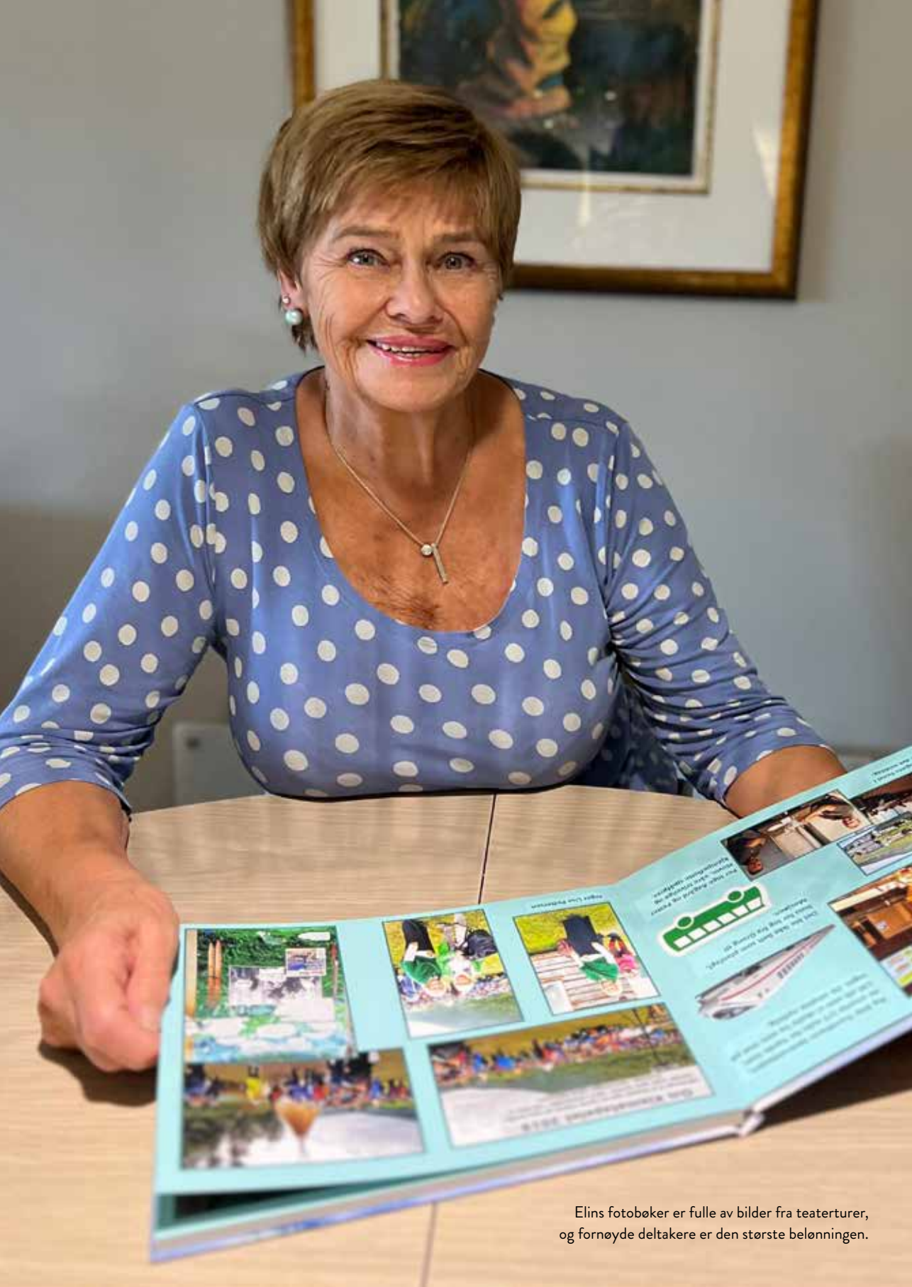
Elins fotobøker er fulle av bilder fra teaterturer, og fornøyde deltakere er den største belønningen.