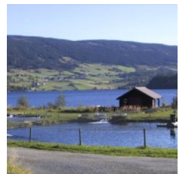
Dammene ligger ved Slidrefjorden