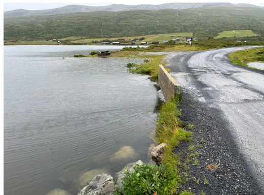
Brua ved Pyttingen 9. august 2023

Seinere på sommeren ble det mer regn, og det toppa seg med det ekstreme regnværet Hans. Mange steder i Valdres og på Østlandet ble det store skader. På Syndin ble mye vann, flomtoppen var 9. august, og da gikk vannet helt opp til brua på Pyttingen. Har det vært så mye vann i Syndinvannene etter at vannstanden ble senket på 1700 tallet?