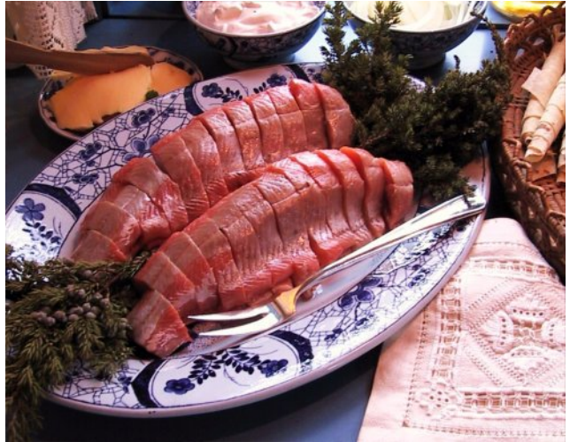
Et lekkert rakfiskbord fra Trøsvik Gård

- For meg er rakfisk mest selskapsmat. Jeg spiser det kanskje 10 ganger i året. Et tips er å spise rakfisk i lefse i solveggen på hytta i påsken. Da smaker det skikkelig godt.