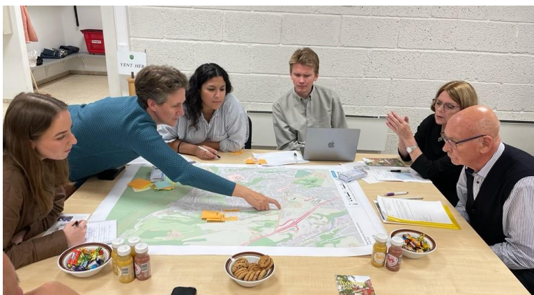
Berger og Rykkinn vel møtte - sammen med idrettsforeningen - prosjektgruppen som arbeider med «snarvei-prosjektet».

I september møtte vellet prosjektgruppen for å legge fram forslag som har kommet opp lokalt. Invitasjonen gikk også ut på Facebook slik at alle som hadde forslag kunne sende dem inn til kommunen.