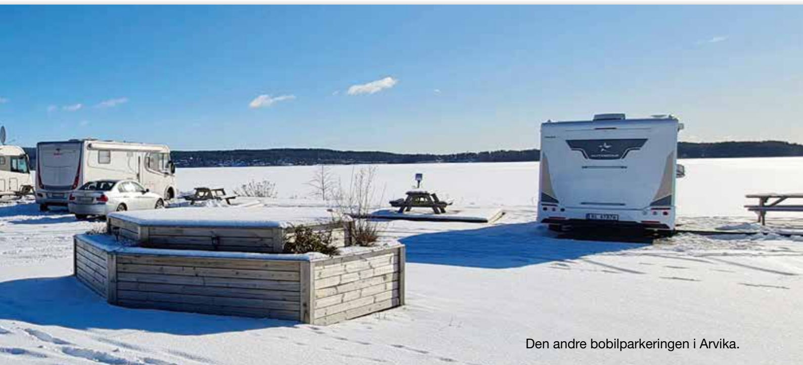
Den andre bobilparkeringen i Arvika.