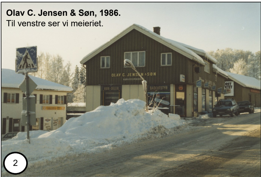
Olav C. Jensen & Søn, 1986. Til venstre ser vi meieriet.

Fotonummer: SKIB 005 054.