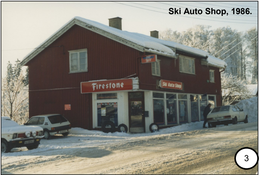
Ski Auto Shop, 1986.