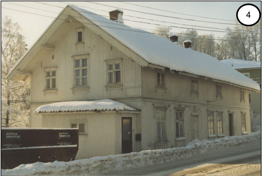
Wergelands Minde, 1986.