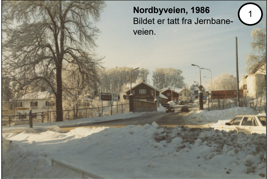
Nordbyveien, 1986 Bildet er tatt fra Jernbane- veien.