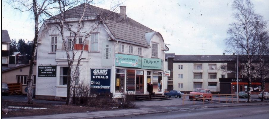
Fotonummer: SKIB 017 218.

Huset sto tidligere på Sjursøya der det var feriehjem for familien Borgen. Flyttet til Ski og gjenoppbygd her ca. 1930.