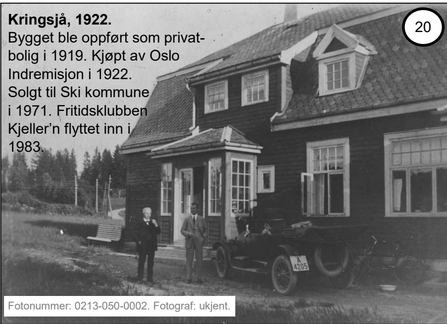
Fotonummer: 0213-050-0002.