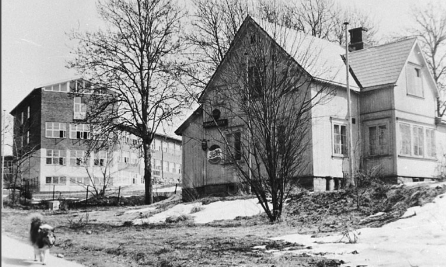
Fotonummer: SKIH 019 028.