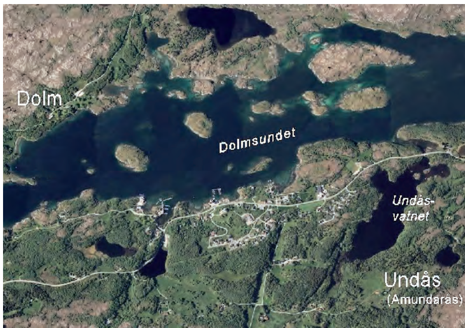
Lokalitetene for hovedkirka i Amundås/Hitra prestegjeld – inntil Dolm kirke brant i 1920.

inn som prestegård og kirkested. Navnet Amundarås hang nok med ei stund etter flyttinga, men neppe mer enn en «mannsalder». Flyttinga må rimeligvis ha skjedd etter 1500.