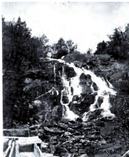
Råfossen i Stadbygd ca 1915. Vassrenna til ei av kvernene nederst til venstre.