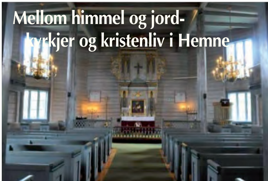
Interiør Hemne kirke.