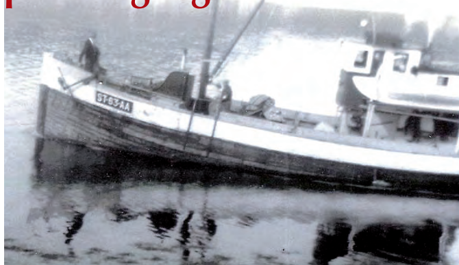
MS Sulsfjord ST 63 AA

I NoG 97 fortalte vi om båten Sulsfjord, som hadde et langt liv i Åfjord. Den gang visste vi ikke noe om opprinnelsen til båten, utover at den fikk en av de første motorene som Brunvoll ved Molde produserte i 1917. Søket fortsatte til slutt landet jeg hos veteranbåtmiljøet i Hemenesberget ved Mo i Rana, hvor jeg fikk tips om søk i Nasjonalbiblioteket.