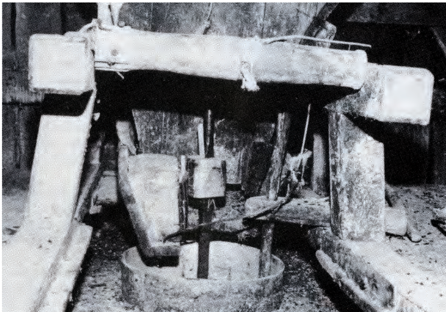
Kverna på Skei. Innmatingen av kverna. Foto: Jon Audun Schei. Fra årbok for Fosen 1989.

Jeg har noen år forlystet meg med å gjennomgå skifteprotokollene for Fosen, til å begynne med for å leite etter de verdifulle ryene, men etter hvert oppdaga jeg stadig interessante ting. Husa på gårdene fulgte vanligvis gården og er ikke nevnt i skiftene. Bare når de var eid av leilendingen, er de kommet med. En type bygninger er likevel ofte registrert separat, nemlig de uanselige bekkverkene. Jeg vil derfor dele disse opplysningene med interesserte og setter opp ei liste over kverner nevnt i de eldste skifteprotokollene 1681-1729 (skifteprot 5 mangler). Lista her er satt opp tinglagsvis etter inndeling fra ca 1723. Det er oppgitt årstall, gård, type kvern, takst i daler, ort og skilling samt henvisning til skifteprotokoll. I ei tid der det snakkes mye om fornybar energi er det verd å merke at utnytting av vasskraft var av stor betydning i det gamle samfunnet.