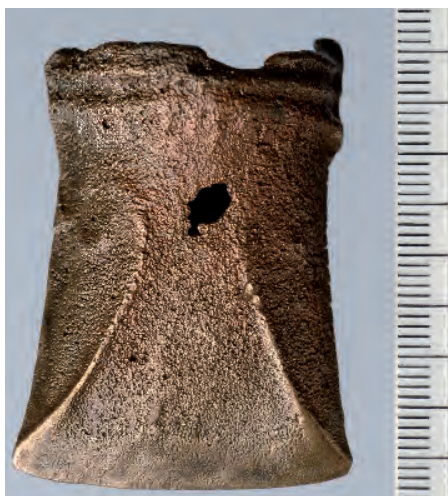
Bronsealder-celt fra Austrått. «Lunset- celten» Foto Per. E. Fredriksen. NTNU Vitenskapsmuseet

området enn det som var oppgitt, det var bare vanskelig å anslå hvor stor den var.