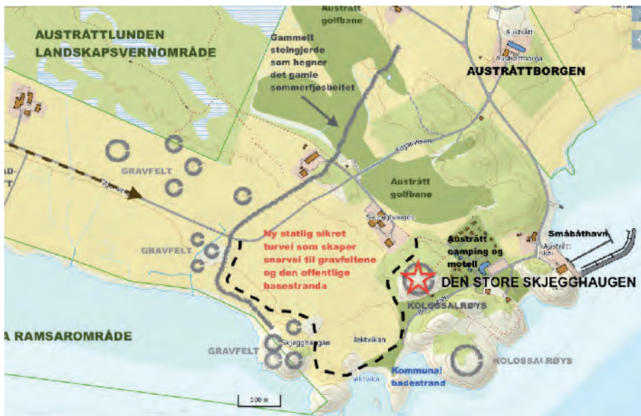
Området rundt Austrått med den store Skjeggghaugen.