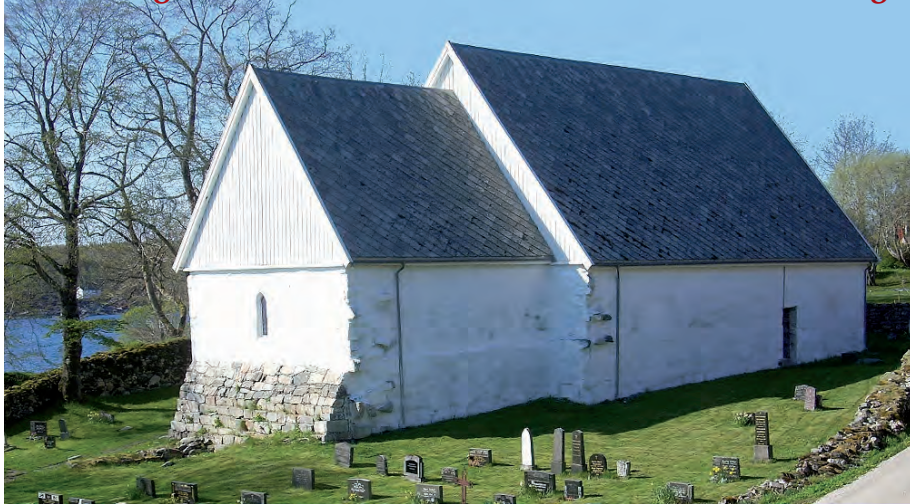
Dolm kirke, gjenreist etter brannen i 1920. Interessant bygning med spennende historie.

- det viktigste kulturminnet i sørvestre del av Sør-Trøndelag