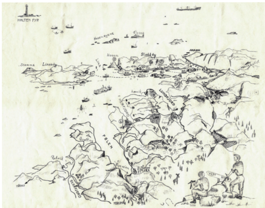
Denne tegningen var grunnlaget for et vegskilt på 1960-tallet. Tegningen er utlånt av Terje Foss.

Årsmøtet i 2018 skal holdes i Åfjord. Vi har valgt å legge møtet til Harbak i det gamle Stokksund herred, et område hvor det nå er økende aktivitet og stor optimisme.