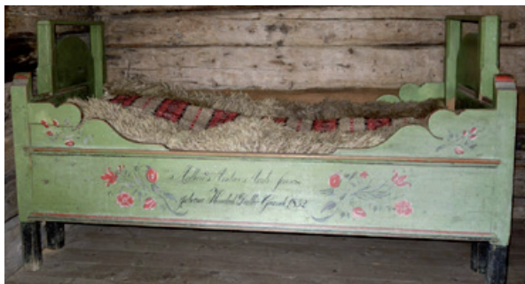
Denne senga frå Grande på Ørlandet er utvendig 178 cm lang, innvendig ca 165 cm. Den er no på Sverresborg Trøndelag Folkemuseum, der den står i Kråkøystua frå Roan.