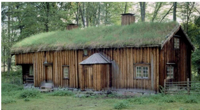
Hovdestua fra Ørlandet, som no står på Norsk Folkemuseum i Oslo. Eldste del av stua er fra 1700, den andre fra 1850.

I tida omkring 1860 skjedde det mykje nytt. Samfunnet og livet vart omforma. Vi omtalar gjerne denne tida som «hamskiftet».