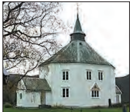
Vinje kirke på Vinjeøra er en åttekantet kirke fra 1820. Kirken har et romansk krusifiks, muligens fra 1200-tallet.