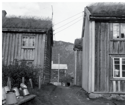
Den smale passasjen mellom Gusstuo til venstre og Innestuo til høgre. Bak til høgre ser vi enden av Krestenstuo, og bakerst Nestuo. I forgrunnen melkespann til tork. Fra Spesialsamlingene, Universitetsbiblioteket NTNU. Foto: Klaus Forbregd, 1961.

sameie. Slik var det på mange gårder, men på de fleste ble det foretatt utskifting av jorda og oppløsning av fellestuna på slutten av 1800-tallet. Det var ytterst få gårder der den gamle gårdsstrukturen ble beholdt så lenge som på Hovdan.