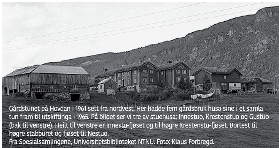
Gårdstunet på Hovdan i 1961 sett fra nordvest. Her hadde fem gårdsbruk husa sine i et samla tun fram til utskiftinga i 1965. På bildet ser vi tre av stuehusa: Innestuo, Krestenstuo og Gustuo (bak til venstre). Heilt til venstre er Innestu-fjøset og til høgre Krestenstu-fjøset. Bortest til høgre stabburet og fjøset til Nestuo.