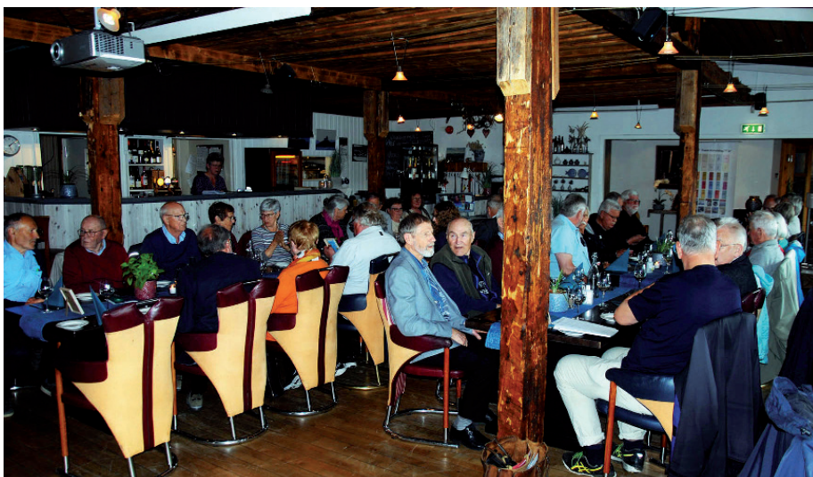
God stemning under jubileumsmiddagen i Lysøysund.