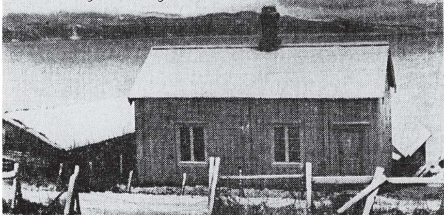
Stua og nauset i Bonvika i Lensvika der Kristoffer Bonvik bodde med Rissa i bakgrunnen.