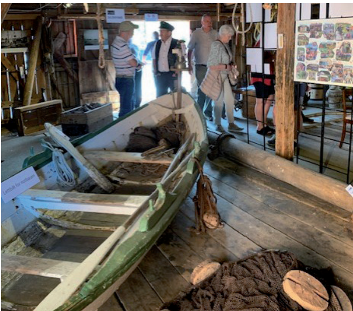
Fra utstillinga på Foss-brygga i Råkvåg.

Mælan skole har bekreftet at de og vi skal samarbeide om å utarbeide tre prosjekter som skal fastsettes i skolens lokale læreplan. Dette er basert på mål i den overordnede læreplan, slik som å gi elevene historisk og kulturell innsikt, bidra til at elevene kan ivareta og utvikle sin identitet og lære å kjenne verdier og tradisjoner.