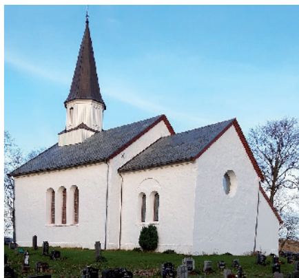
Ørland kirke på Viklem er bygd på 1200-tallet.