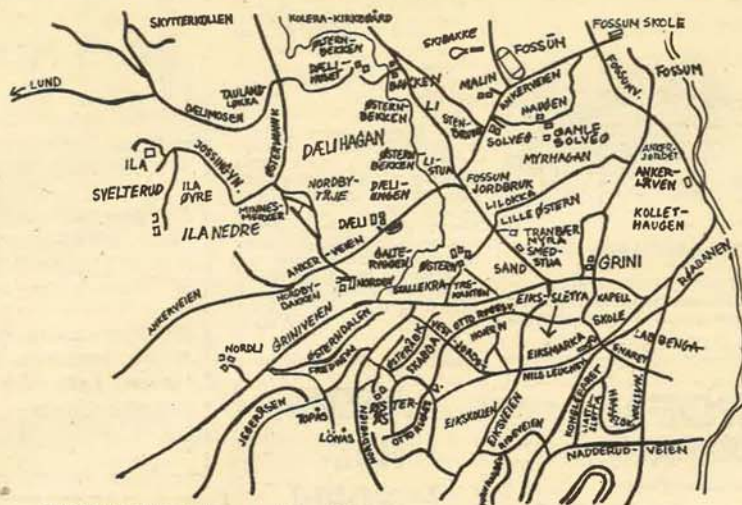
Kartskissen viser stedsnavn med dype historiske røtter.

Men stopp en halv, la oss sveve litt over vår drabantby anno 700. Her er det skjedd noe. Nå er det kommet gårder her, med gården Eik i sentrum, med mye beitemark omkring. Det er vel omtrent midt i Lauritz Sands vei, kan vi anta. Og der har vi Dolin (det er vår turistguide Bærum-boka som forteller dette) og vi identifiserer straks at det er Dæli, selv om den nok ligger litt lengre ned i dalen enn vår tids Dæli. Egentlig burde