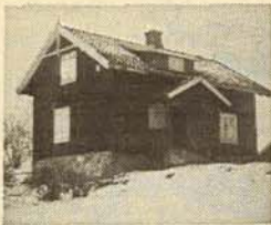
Plassen Bratli i Ruglandsveien

På eiendommen finnes mange, store, praktfulle løvtrær, og hagen er i dag nydelig opparbeidet. I tidligere tider var her i skråningen mot vest 4 kalkstenbrudd, resten av disse kan enda sees. Bratli var inntil 1940 husmannsplass under Grini gård.