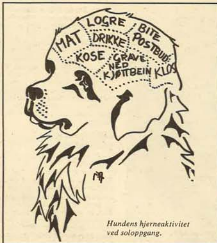
Hundens hjerneaktivitet ved soloppgang.

Den godartede form er, som leserne sikkert har