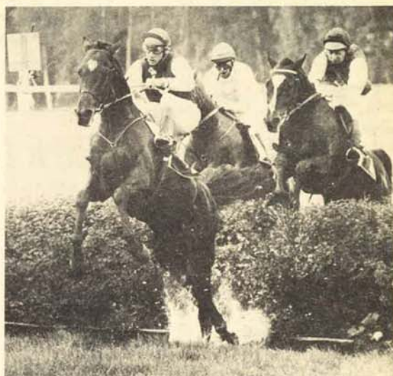
Fart og spenst over sprangene under ritt på Øvrevoll.

De nokså ofte skiftende restauratører har forsøkt forskjellige tiltak. Et av disse var ungdomsaftnene i samarbeide med lokale organer. Økonomisk ble de dessverre etterhvert en umulighet, og dessuten står det ikke til å nekte at interessen for sli-