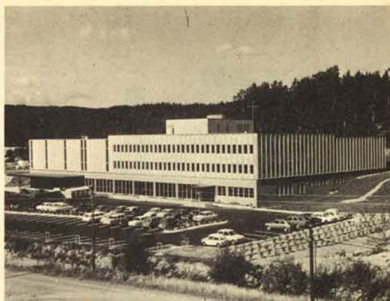
Nybygget føyer seg vakkert inn i terrenget.

Selv om det i planleggingen av bygget er produksjonens krav som er stilt i høysetet, har Centraltrykkeriet tatt meget sterke hensyn til det estetiske i såvel utformingen av selve byggets utseende, som når det gjelder grønntanlegget rundt bygget og parkeringsplassen. For å oppnå et best mulig resultat har man engasjert en landskapsarkitekt, slik at grønntanlegget skal bli en pryd for omgivelsene. Det er på alle måter et moderne og funksjonelt industribygg Centraltrykkeriet nå har tatt i bruk, skreddersydd med innebygget fleksibilitet for dagens og morgendagens produksjonsmetoder. Og når første byggetrinn nå er gjennomført, så har man fortsatt god plass til disposisjon for å utvide bygget etter behov. Idet hele tomten er på 23 dekar. Selv om produksjonen i årene fremover øker kraftig, skulle utvidelsesmulighetene være tilstrekkelige i overskuelig fremtid. B. T.