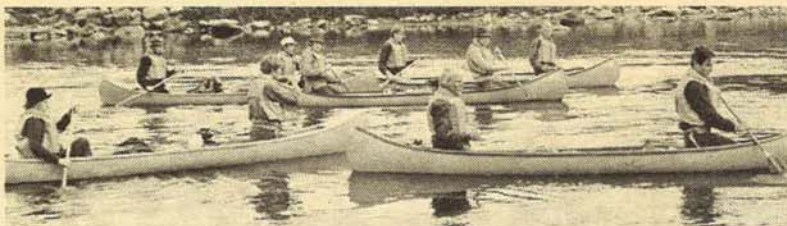
Kanopadlere fra speidertrupper på Eiksmarka og Eikeli.