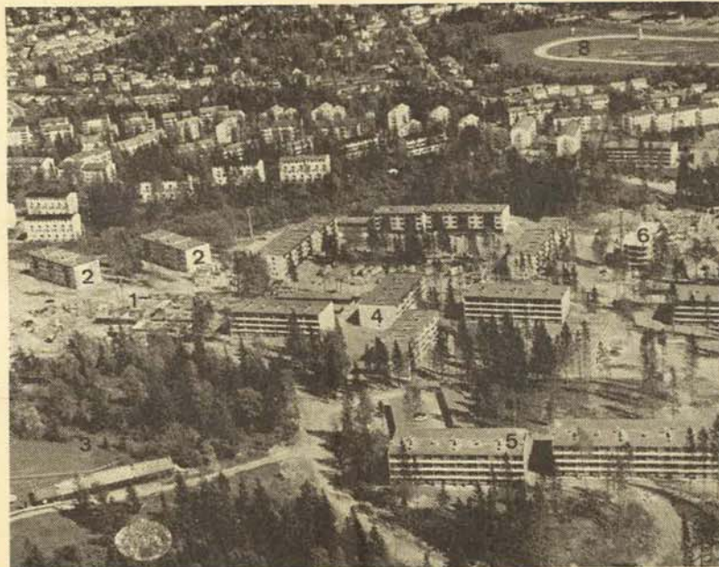
Eiksmarka, Østerås og Øvrevoll.

I april 1951 var det registrert 105 familier som pliktige medlemmer av Eiksmarka Vel hvorav ca. 25 bodde i Labben, 54 i Eiksvæien, 11 i Nordjordet, og noen få i Ruglandsveien og Vollsveien.