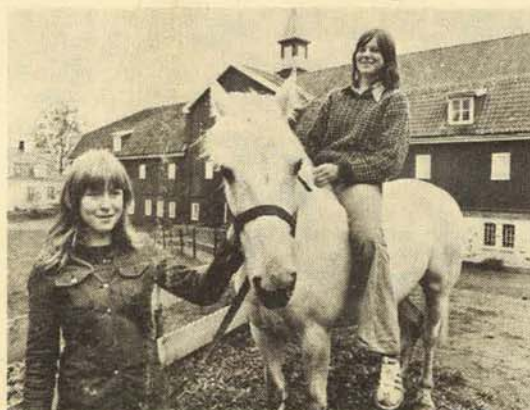
Ridning er blitt en populær sport blant Eiksmarka-ungdom.

– Etter min oppfatning driver vi sosialt ungdomsarbeid. Vi beskjefter ungdommen, gir den fysisk trening slik at