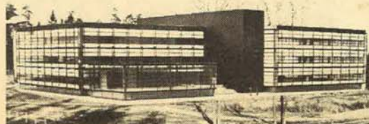
Norden-bygget på Østerås.