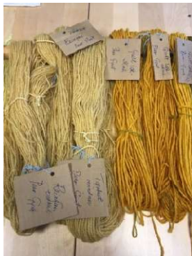
Til venstre: Gult løkskall og tørket Reinfann

Til høyre: Rødløkskall. Det blållilla garnet er farget med et kjøpt fargestoff som heter Blåbark.