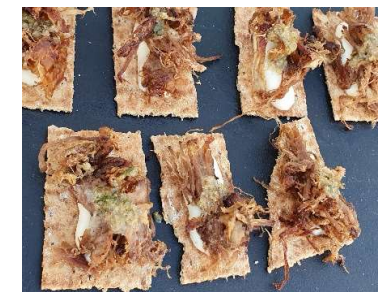
Smaksprøve av Tømte-lam