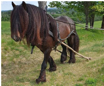
Alt klart for at skoklene skal falle

Det ble en fin kveld på tunet på Sør-Kringler, det var godt vær og god stemning.