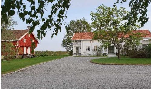
Skyssstasjonen Østigarn Homble