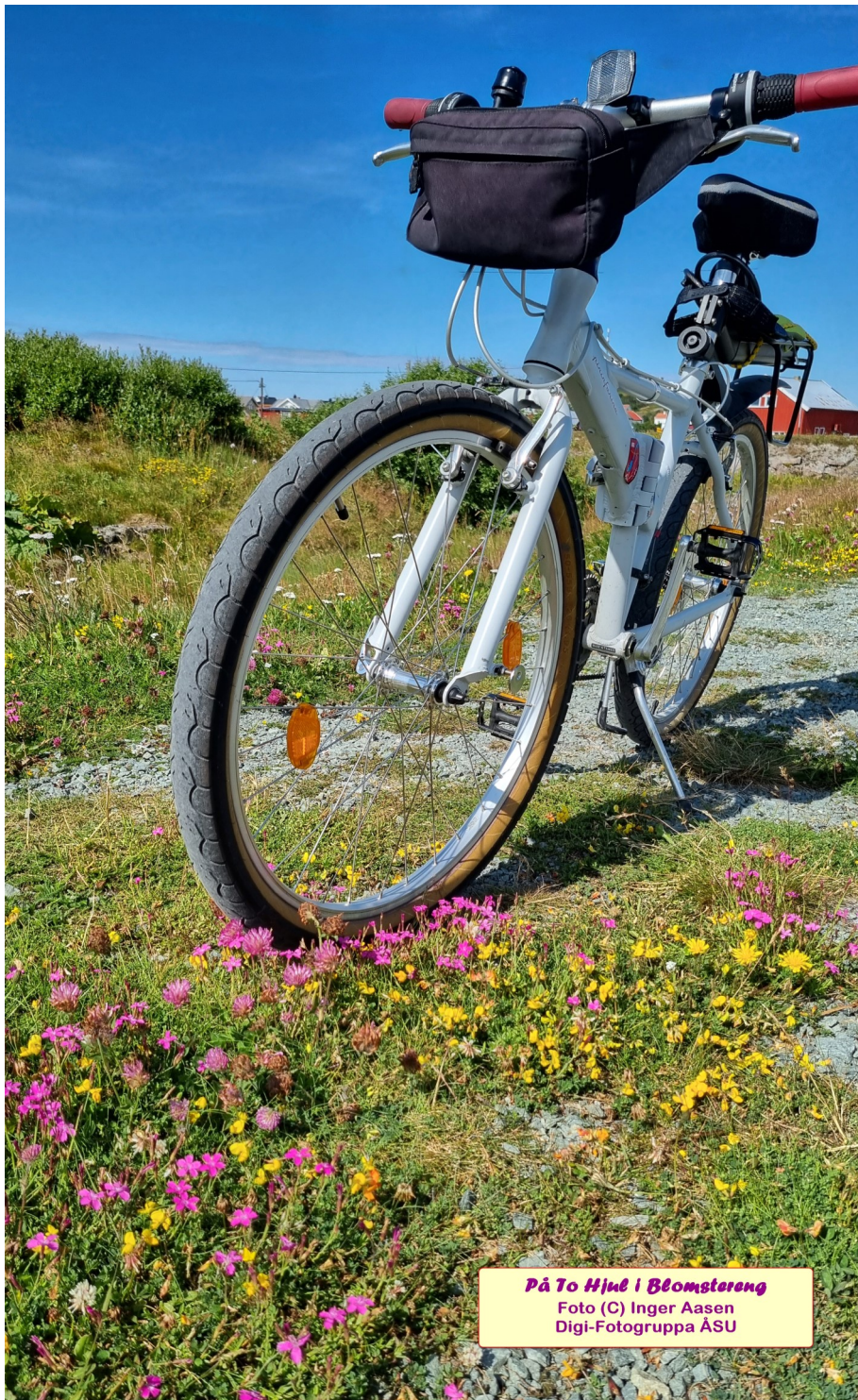
På To Hjul i Blomstereng