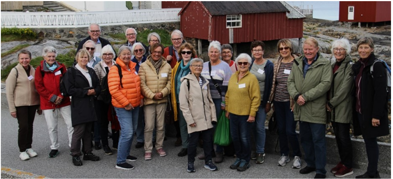
Ein glad gjeng ÅSU-medlemer på Ona-strandhogg

I Ålesund senioruniversitet sin leiten etter meir kunnskap, har senioruniversitetet i sine planer at dei skal innom dei aller fleste stader i Ålesund kommune. Tysdag 29.08, var turen komen til Ona. Haram kulturhistoriske lag fekk, i byte mot å dela lokal kunnskap om liv og lagnad langs ruta, lov til å vera med. Turen vart gjennomført ved bruk av kollektivt, og Fram sine sjåførar gjorde ein flott innsats for å tilleggeretta turen på beste vis. Alt gjekk som