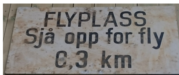
Frå dagleglivet på Vigra