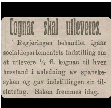
I gamle dagar