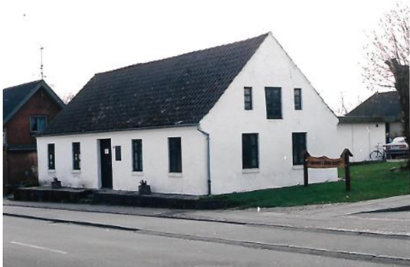
Klubblokalet til Lions Club Farsø. Huset er også museum for forfatteren Johannes V. Jensen.