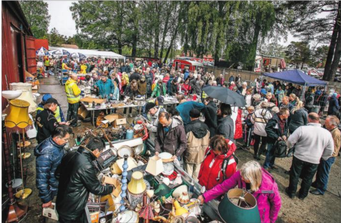
SLAGMARKEN: Her er loppemarkedet ti minutter gammelt og folk har stillet til bordene og hengerne som fortsatt er fulle av det andre har kassert, men som for noen fortsatt er skatter.