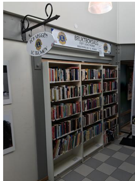
Bokhylla på Tromøytunet

Dette er en utrolig hyggelig tjeneste som mange "kunder" setter pris på, og klubben kan med denne inntekten yte mer hjelp til dem som trenger det!