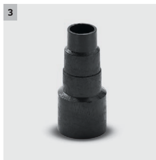
3 Optimal tilkobling