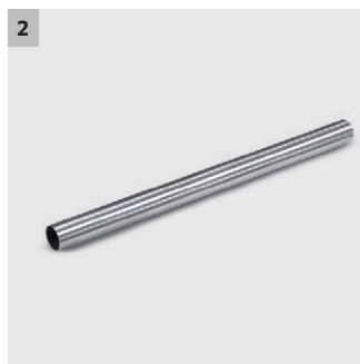
2 Høy kvalitet, robust design