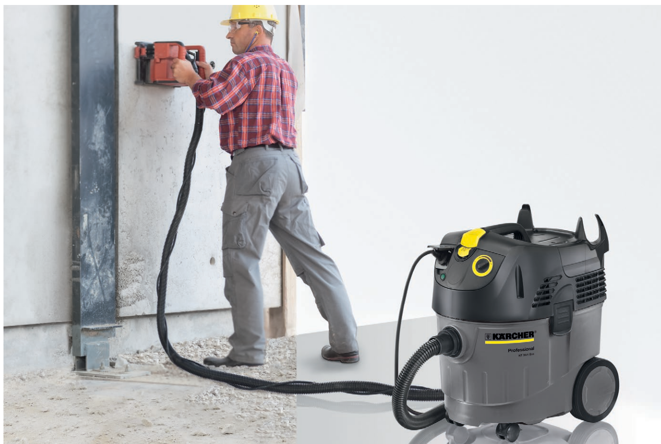
NT 35/1 Tact Te