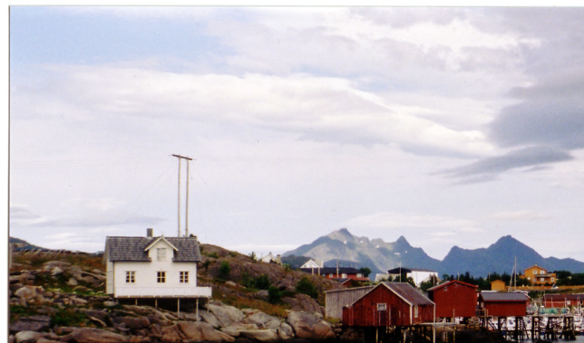
Tur til Lofoten, her Ballstad, se side 6