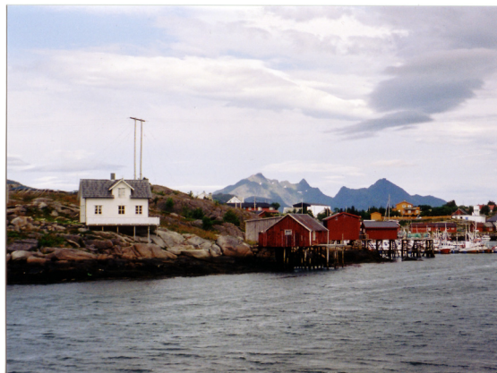
Ballstad i Lofoten

Vi tok dagsturer rundt om på de fleste steder, men at norsk natur var så skiftende og pen trodde jeg ikke. Vi var på en del gamle fiskevær og ble imponert over hvor stort dette en gang hadde vært. Jeg ble overrasket over landbruket og hvor grønt alt var.