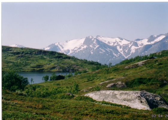
Fra Korgenfjellet hvor vi overnattet

Neste stopp var Røros. Det er litt moro å snakke med folk som er på tur, og her kom jeg i prat med en fransk familie, og vi utvekslet erfaringer fra hvert sitt land.