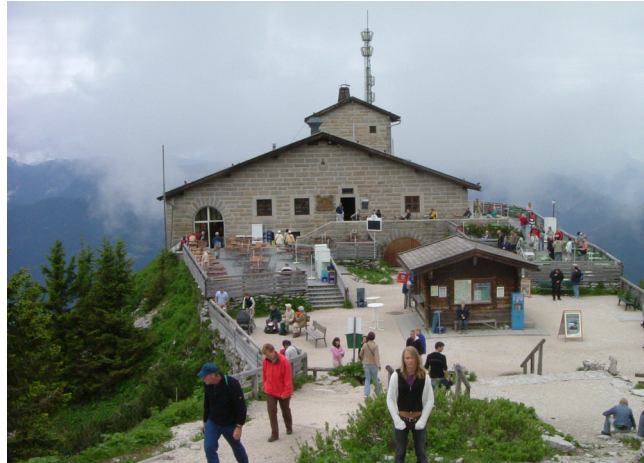
Steder som er verdt et besøk, se side 20