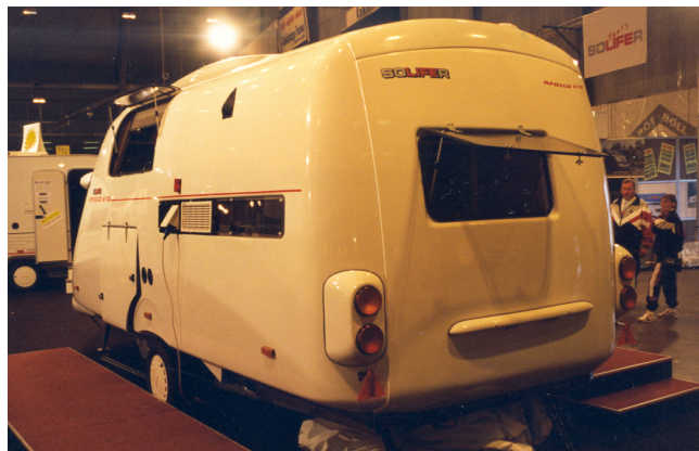
Solifer er 40 år i år, her Solifer Apollo, se side 23