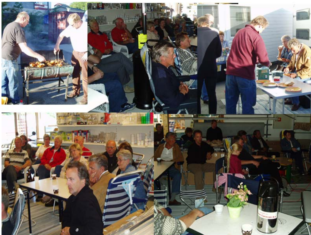
De frammøtte medlemmer koste seg denne kvelden

Ellers så er det jo flammehemmende stoffer i interiøret, samt at det var impregnert for å lette flekkfjerning. Det ble også en diskusjon på forsiktighet rundt gassinstallasjoner, slik at man unngår ulykker. Konklusjon gikk på at det i forhold til antall vogner er det lite ulykker, men 1 ulykke er 1 for mye.