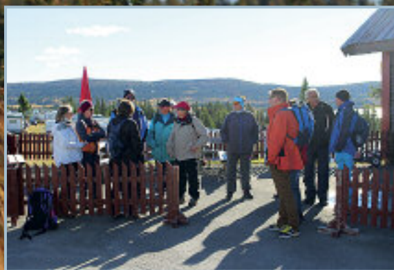
Klare for tur.