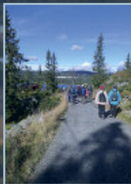
Campingen i sikte. Målet nærmer seg.