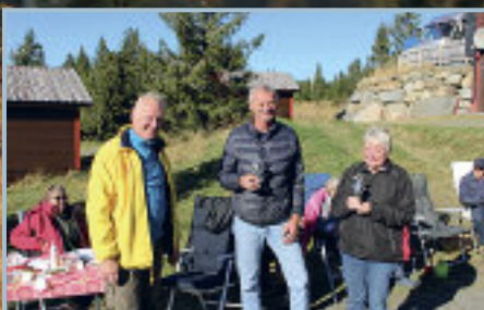
Stolte vinnere av hestekokastinga.