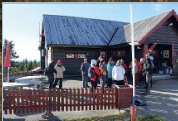
Gjengen samles for felles tur.

PS: Treffkomiteen opplyste at de gjerne tar imot tips om mulige treffsteder, ikke for langt unna og med mulighet for å ta imot 10-12 vogner utenom fastliggerne.