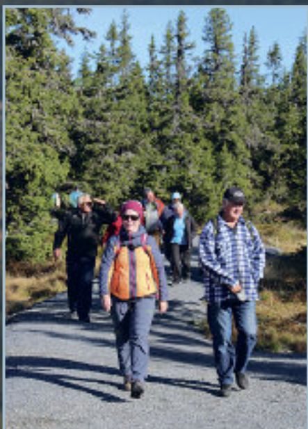
En sprek gjeng på høsttur i flott solskinn.