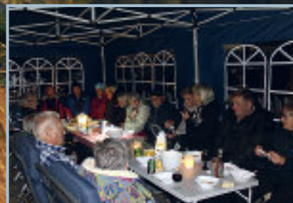
Vi koser oss i partyteltet på kvelden.