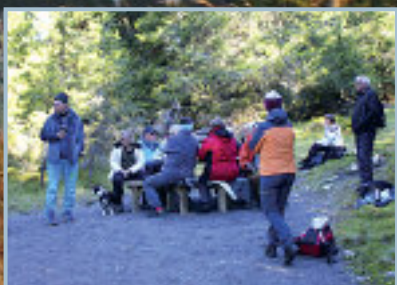
Mat må vi ha.