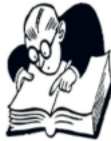
Skrevet av Aage Johansen etter dykk i arkivet