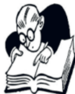
Skrevet av Aage Johansen etter dykk i arkivet