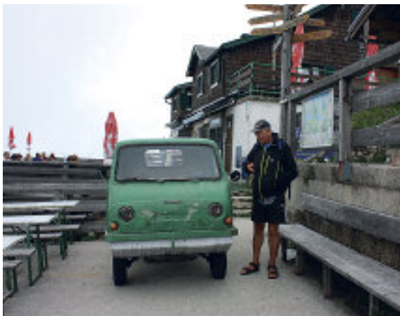
En rar, liten bil vi fikk se toppen. Lurer på hvilket merke?