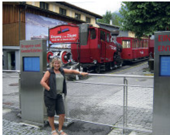
På stasjonen i St. Wolfgang.

ende jo høyere vi kom. Det som gjør at denne jernbanen kan klare så store stigninger, er at den drar seg oppover ved hjelp av tannhjul mellom skinnene. Halvveis opp mot toppen møtte vi et annet togsett på vei nedover. Ved denne stasjonen ble det etterfylt vann på dampkjelen samt at togføreren måtte ut og pense om manuelt, noe man ikke ser så ofte lenger.