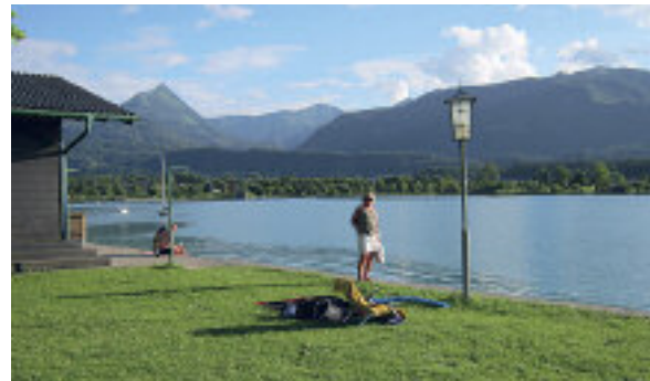
Fristende å ta en dukkert i St. Wolfgang See i kveldingen.