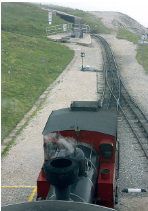
Toget skyves oppover av lokomotivene. Nedover er lokomotivet bak.