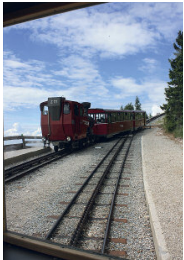
Møtende tog på vei ned.