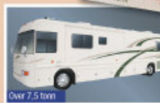
Over 7,5 tonn

«Bobilførerkortet» vil gjøre at du får mer glede av å ha bobil. Enten du velger litt påbygging på førerkortet du har i dag, eller om du ønsker å utvide det til en høyere vektklasse, - C1 eller C.