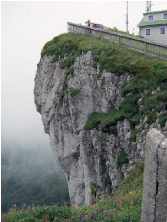
Det er bratt!