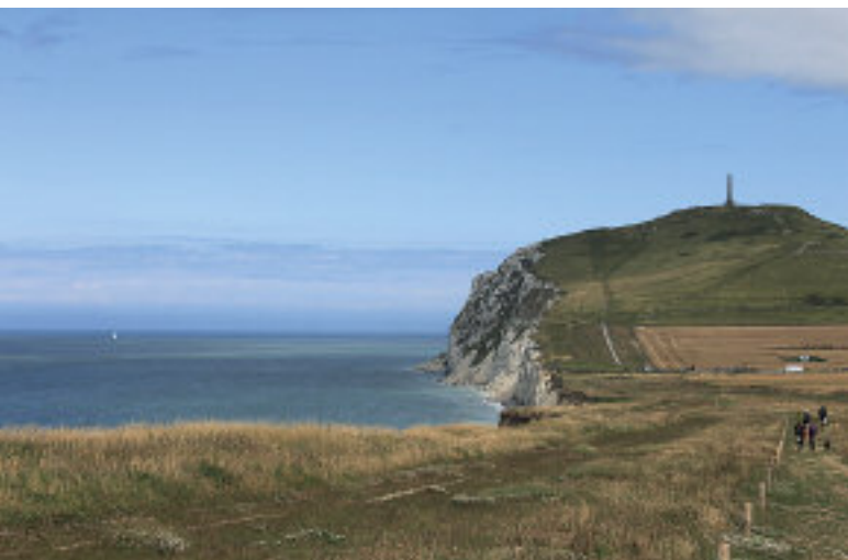
Klippene ved Calais.

veier og feil side, og vi hadde lyst til å prøve «Bed and Breakfast» for å treffe lokalbefolkning. Derfor bestemte vi oss for å kjøre med bil og vogn til Calais i Frankrike, og parkere vognen der i