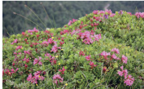
Nydelig vegetasjon på toppen.