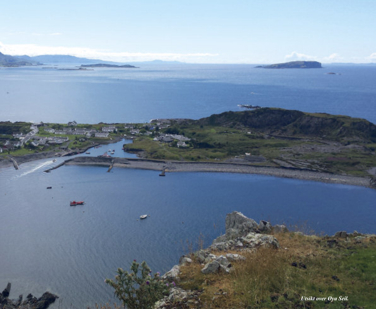
Utsikt over Øya Seil.

9 dager, mens vi var i England og Skottland.