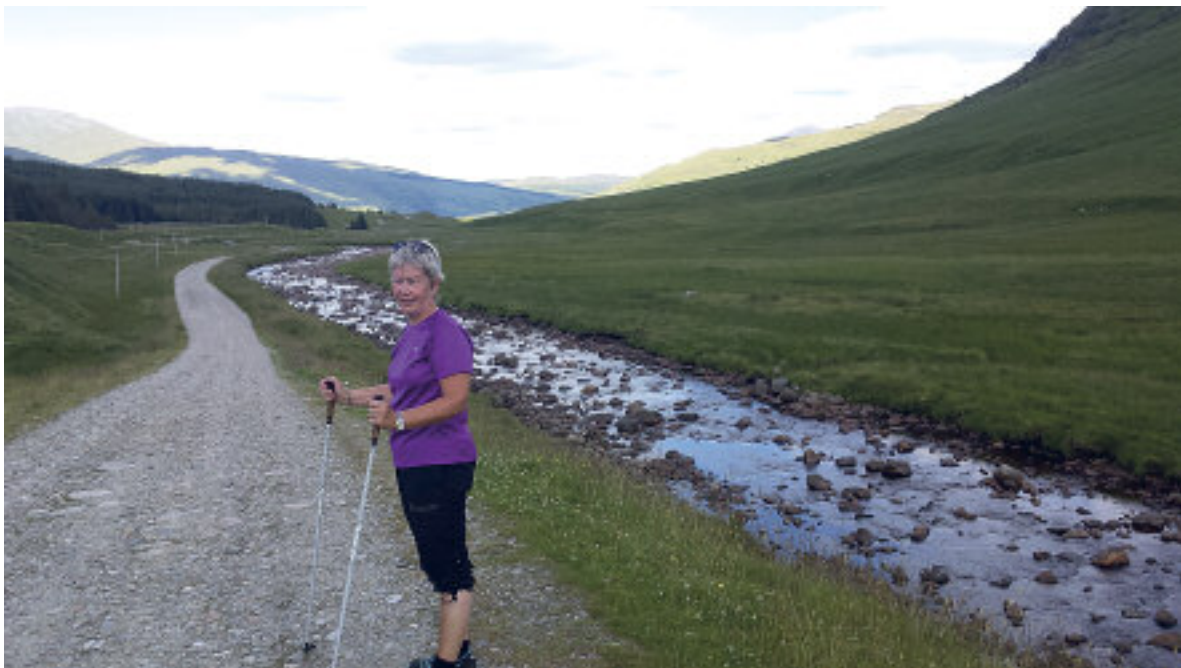
Frøydis i en vakker dal på Høylandet.

Neste stopp ble i Annan, så vidt inne i Skottland. Her var det en festival, så det var litt vanskelig med rom, men vi fikk et greit rom på et lite hotell. Neste dag ville vi ta det litt roligere, og kjørte langs kysten til Girvan. Her hadde vi utsikt fra rommet vårt utover havet, mot øya som de tar ut steinene til curling. Vår vært fortalte at granitten derfra var så spesiell at alle curling-stener ble laget der.