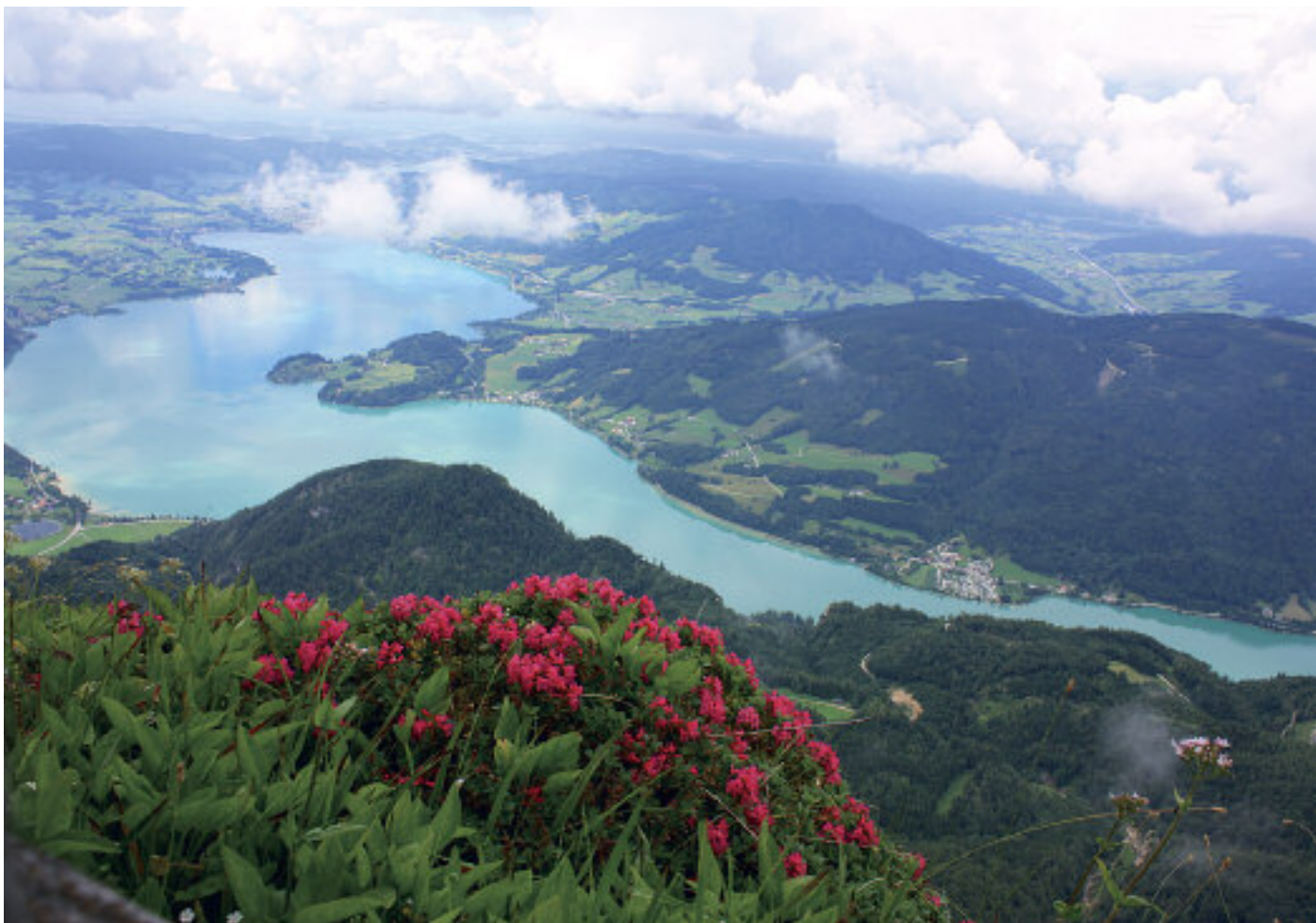
Utsikt over Mondsee fra toppen.

På vei hjemover denne sommeren, valgte vi å gjøre en stopp i St. Wolfgang i Østerrike. Det virker alltid så rent og friskt i alpeområdet, og det er en deilig motsetning til de mer brunsvide og steinete områdene vi hadde kjørt i i Kroatia.