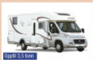
Opp til 3,5 tonn