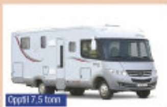
Opp til 7,5 tonn