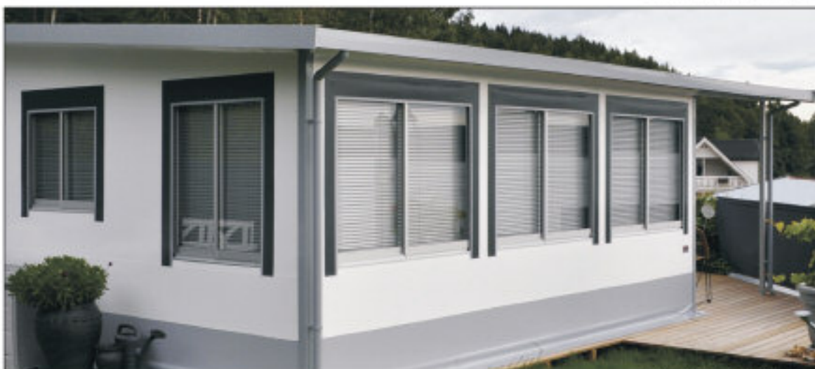
* Bildet viser telt med ekstrautstyr

Helårstelt produsert i brannhemmende PVC duk med solid rammeverk i elokserte aluminiumsprofiler.