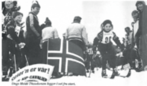
Bildet er fra Caravan nr. 2 1979

I påsken var som vanlig mange av våre medlemmer på Skeikampen, og hele 250 mennesker fra NCC's avdelinger i Oslo, Glåmdal og Østfolds stilte til start i årets "Cabby Cup", som skirennet ble kalt dette året.