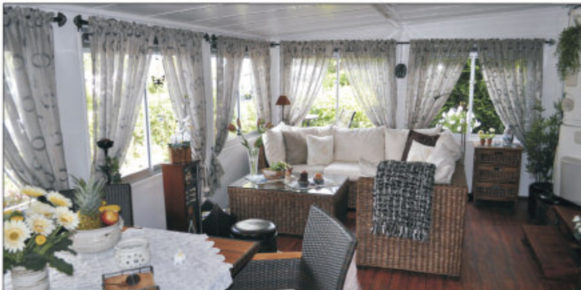
* Bildet viser telt med ekstrautstyr