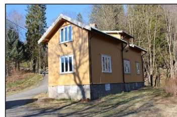
Damvokterboligen og ”Bekkestua” sto for fall.