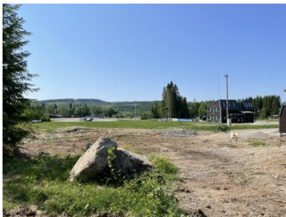
Bildet viser utsikt fra der Gapahuken er tenkt plassert.

Ny gapahuk er også bestilt og vil være på plass ganske snart. Denne vil bli plassert rett ovenfor pumpehus, og vendes ut mot skistadion og fotballbane.