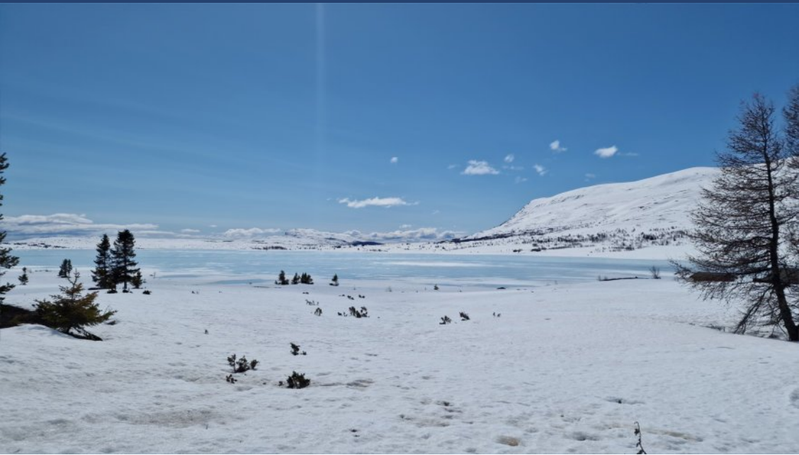
Bildet er tatt 17. mai 2023