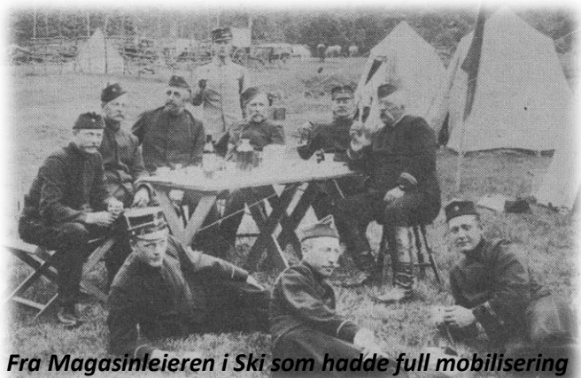
Fra Magasinleieren i Ski som hadde full mobilisering