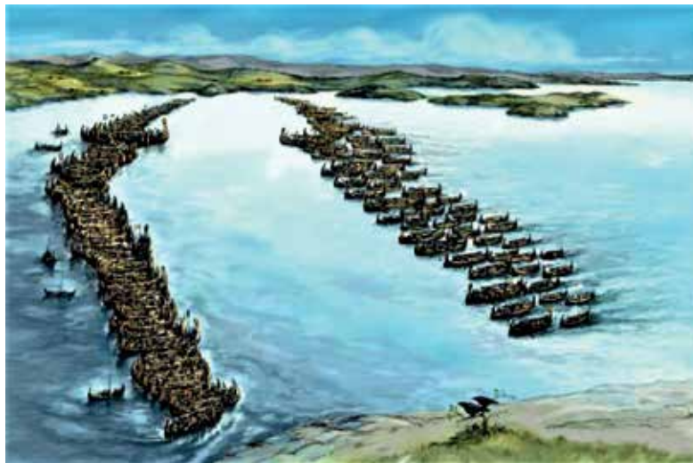
Slik innbiller historikerne hvordan skipene sto mot hverandre i slaget ved Hafrsfjorden. Haralds hær til venstre

Det hersker ingen tvil om at Harald Hårfagre var en klarttalende og sterk småkonge. En mann som ikke likte noen form for motstand. Noe som kunne ende med drap. Dermed opparbeidet han seg et omdømme at det kunne være farlig å sette seg opp mot småkongen som lot hår og skjegg vokse til han hadde samlet Norge til ett rike. Før han ble «klippet» het han Harald Luva på grunn av sitt bustete hår og skjegg. Hårfagre overtok Luva-navnet da kong Harald hevdet å ha blitt litt av en kjekkas etter at «frisøren» hadde gjort jobben.