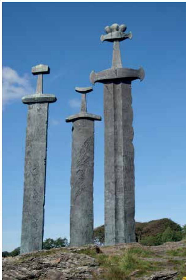
Minnesmerke etter slaget ved Hafrsfjord.

Nå skal det tas i bruk blant annet ultralyd som kan «se» tre meter under mudderet og annen havbunn. Klarer man å finne akkurat stedet der slagrestene ligger, kan man