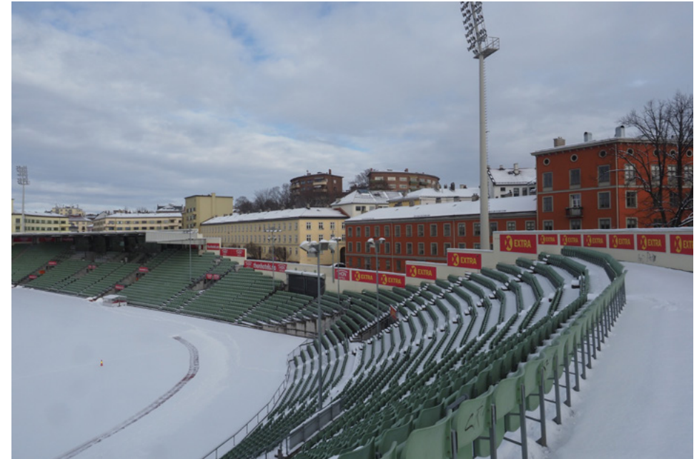
Stadion sett mot Sofies gate og Doblougløkken.

Noe annet var det med «hvor ble det av skøytebane». Jan Erik Vold, Dag Solstad, Kjartan Fløgstad og flere