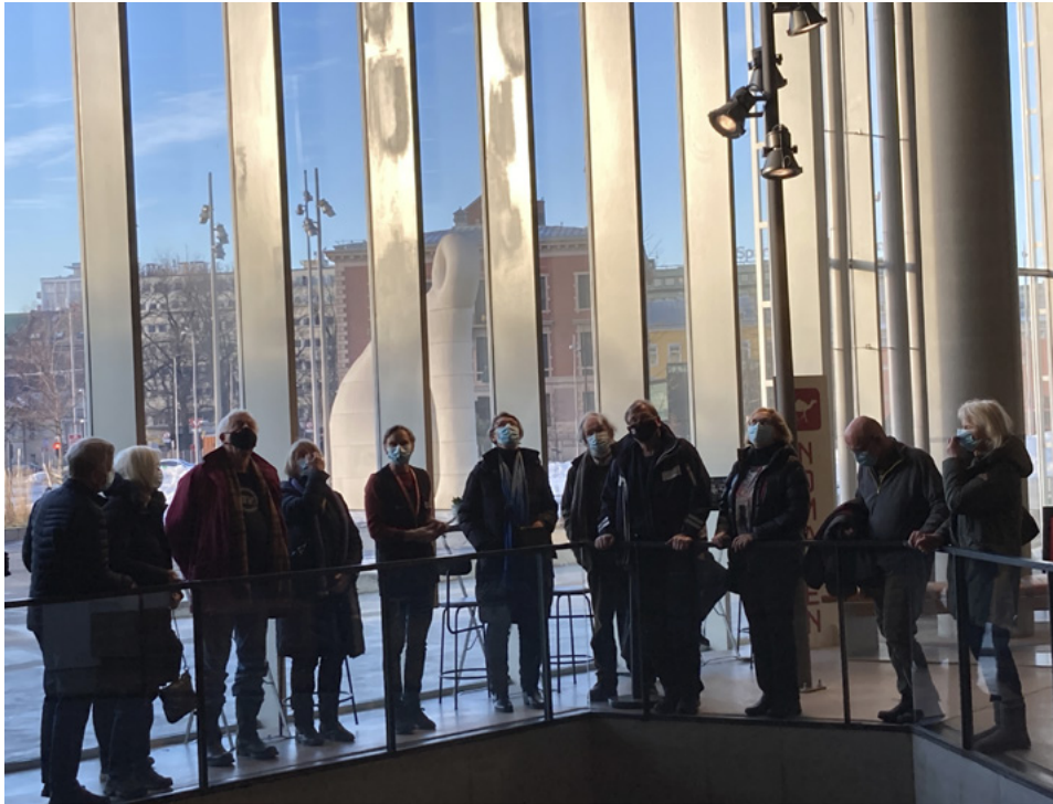
Historielaget har omvisning på Deichman Bjørvika i koronaens tid.

byen. På baksiden: St. Hanshaugen frivilligsentral.