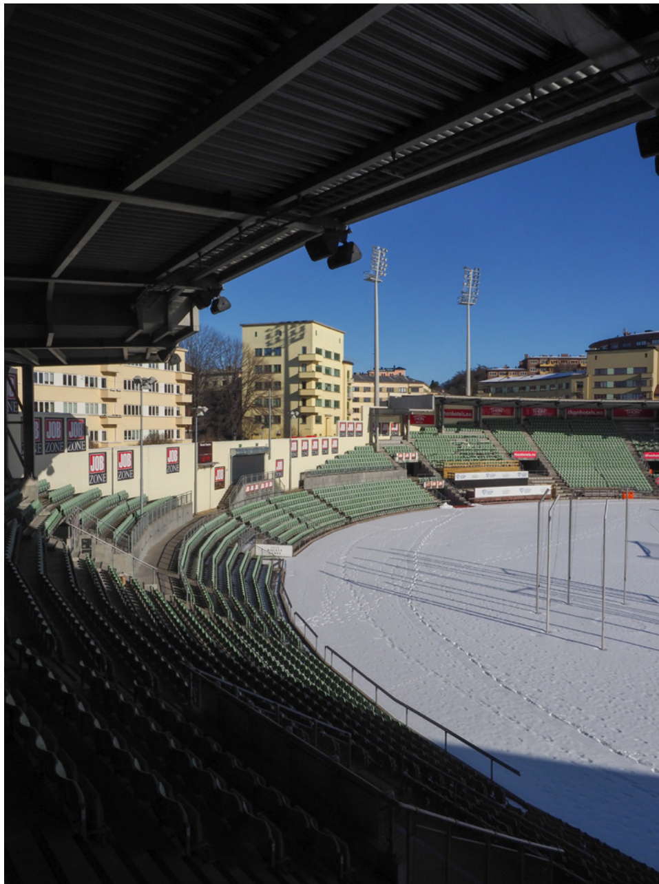
Nordre sving..