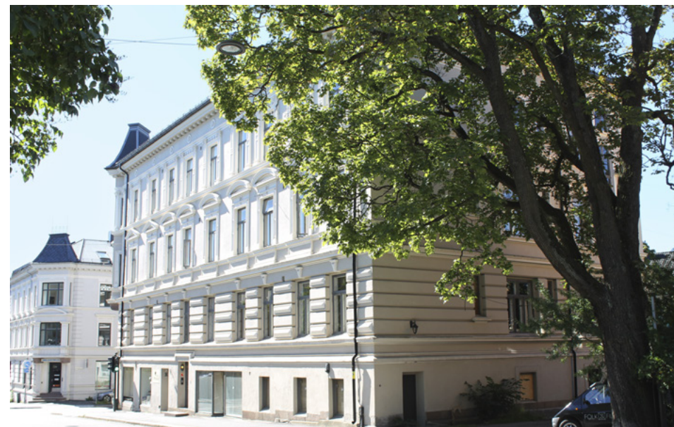
Bolteløkka allé 10.