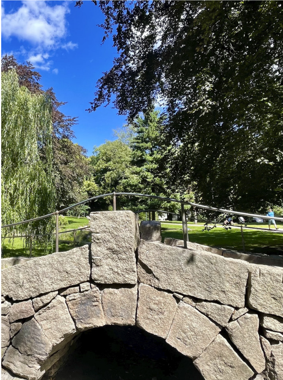
Steinvelobroen, St. Hanshaugen.