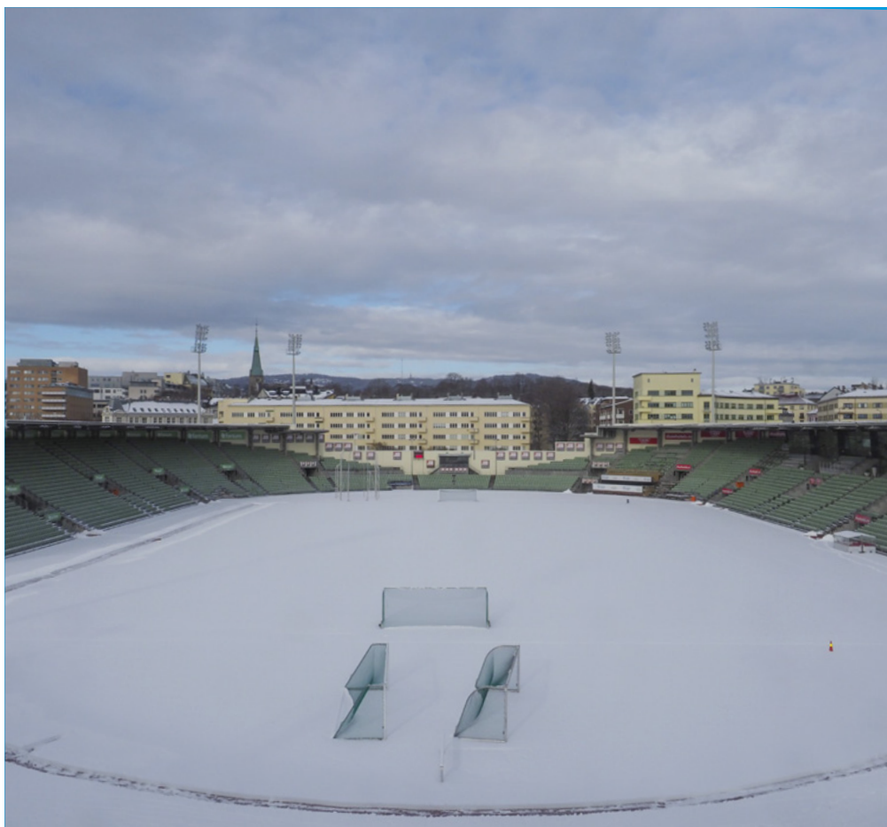
Bislett stadion sett mot nord og Louises gate.