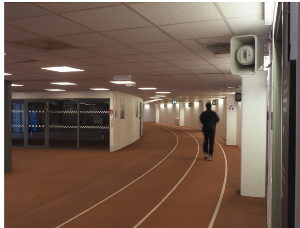
Løpebanen under stadion.

verdensrekord i bygging av stadion her. Riving startet i mai 2004 og så klarte man å gjennomføre den første Bislett Games i juli 2005. I løpet av de neste fem år fikk vi ekstra midler til tak over hovedtribunen, som Riksantikvaren hadde sagt nei til, diverse innredning av kontorer, innendørs løpebane (under tribunen) og diverse uteanlegg, og sluttsummen ble 480 millioner.