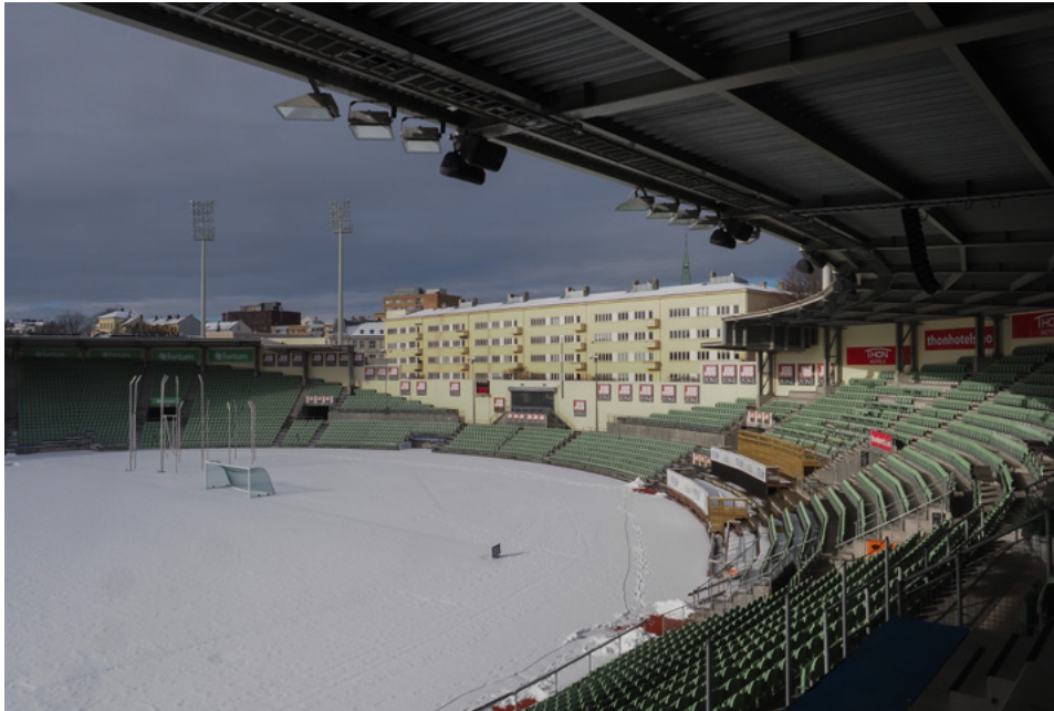
Sett mot nord og Louises gate.

være parkering her? Park – Lille Bislett – hva gjør vi med den? Og ikke minst var det dette med vern.