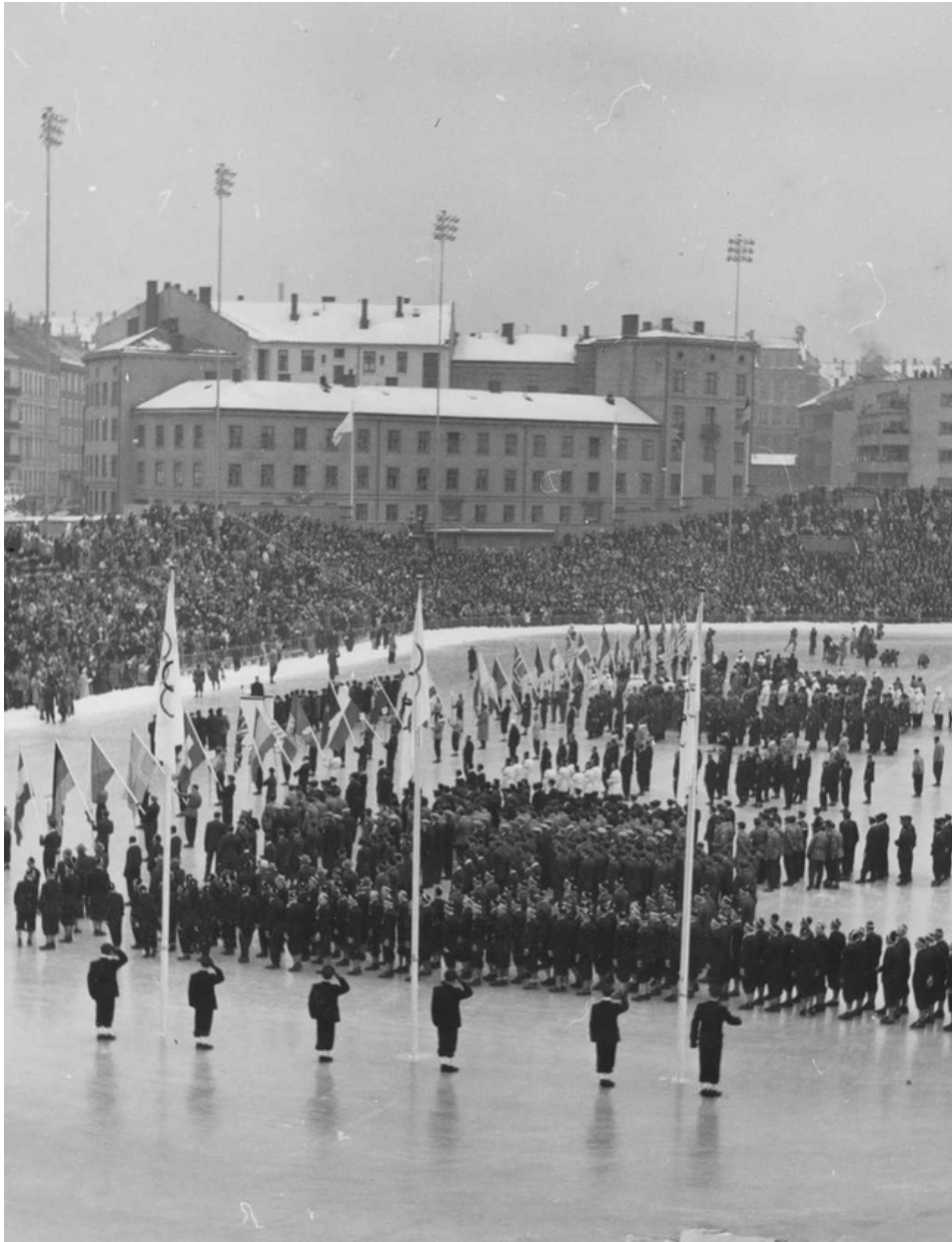
Olympiske vinterleker åpnes på Bislett stadion i 1952.