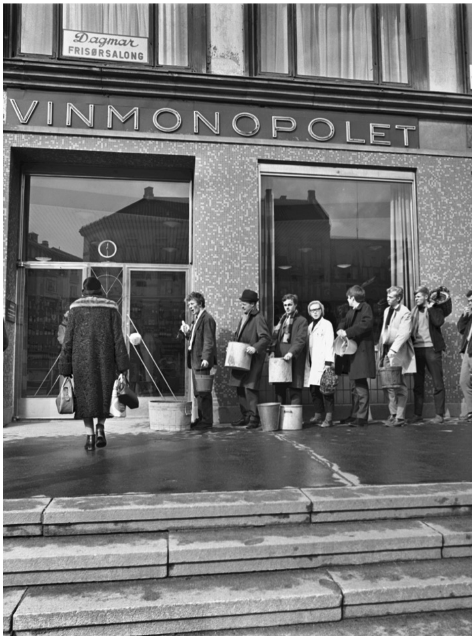
Kø ved Majorstuhuset 1969.

Til understøttelse av en truet tradisjon bringer vi en av mange gode offentlige aprilspøker.