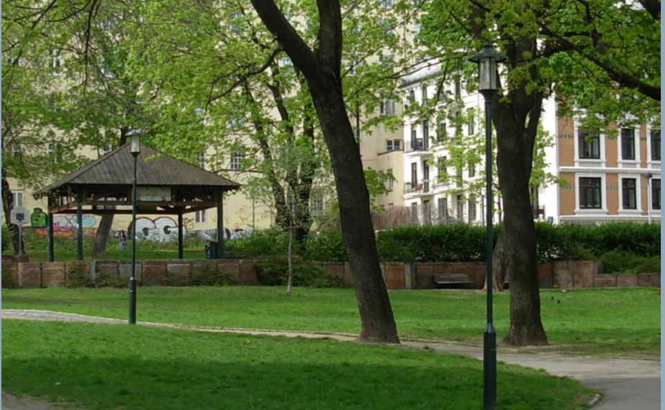
Kristparken 2008.