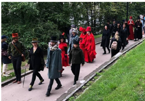
Hatteparaden – eller Hat Walk – langs St. Hanshaugen i 2019.