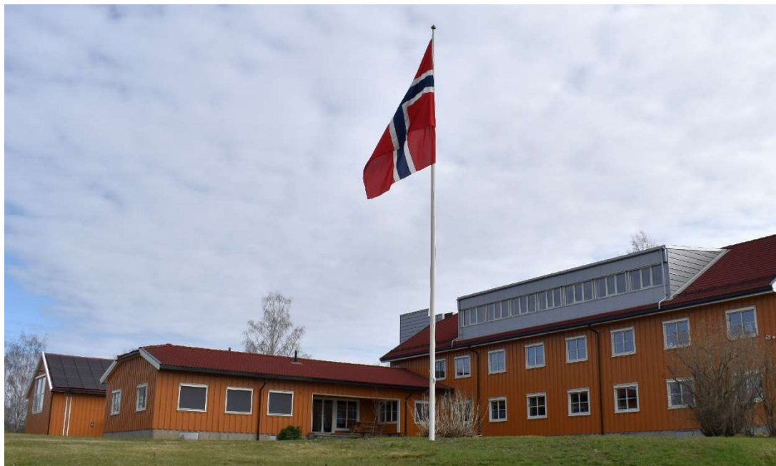
Flagg på Leiravoll