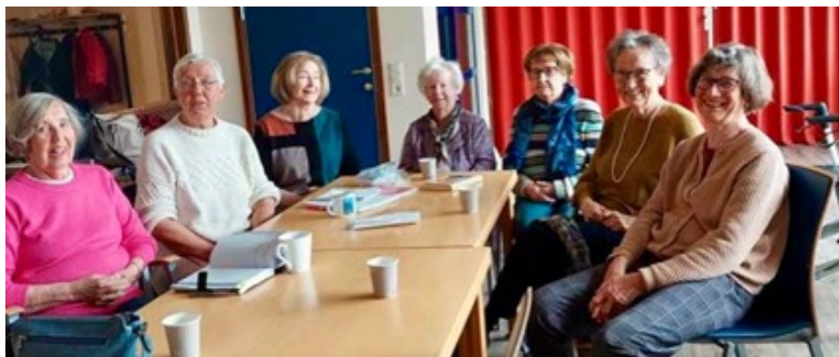
Litteraturgruppe 3 har møter på Frivilligsentralen.