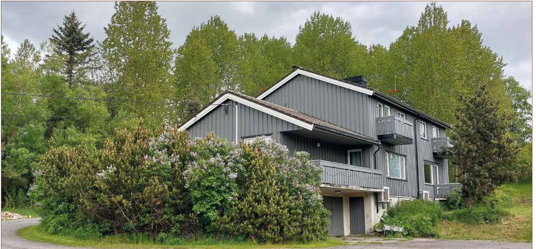
2022. Vevelstadveien 114