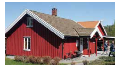
Smerta 2022. Tidligere husmannsplass under Bekkevar.