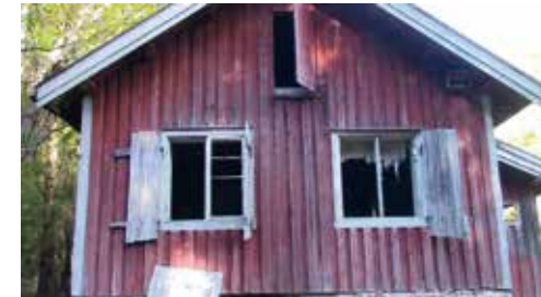
Snikedal 2016. Tidligere husmannsplass under Krokhol.

Noen tidligere husmannsplasser er pusset opp, og brukes i dag som feriested, for eksempel Hjellsbråten i Kråkstad. Møllerenga på Langhus, og Tømmerholen ved Sandbakken, er eksempler på tidligere husmannsplasser som kommunen har kjøpt, med sikte på tilrettelegging for friluftslivet. På flere av de gamle husmannstufte kan vi i dag finne en eller annen forenings-/lagshytte, for eksempel speiderhytta på Sterkerud, og Ski jeger- og fiskeforening på Årlia, og Ski Golfklubb på Smerta.