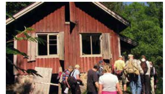
Snikedalen 2016. Husmannsplass under Krokhol.