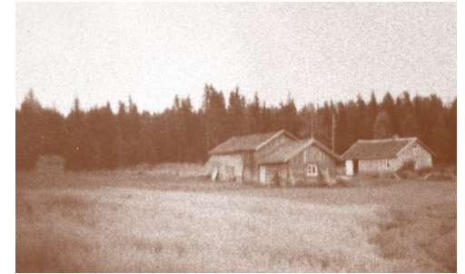
Myrvoll 1953. Husmannsplass under Tømt.