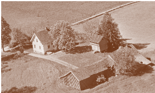
Tronsrud 1959. Husmannsplass under Harestad.