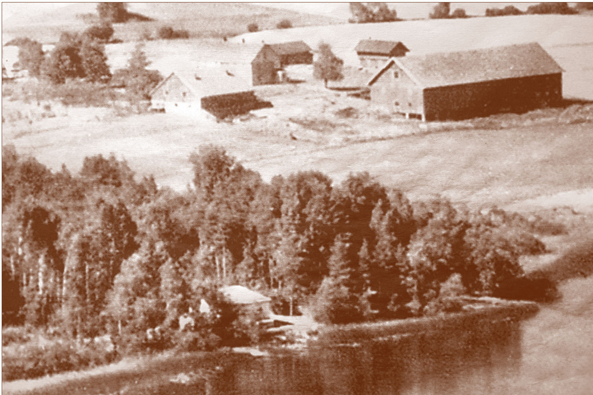
Bilde av Ski vannverk. Gården Lunder i bakgrunnen.