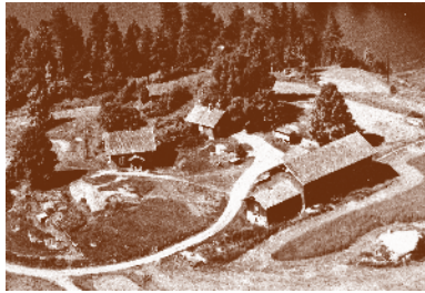
Høybråten gård 1954. Tidligere husmannsplass under Gjedsjø gård. Eget bruk 1836–47.

Rundt regnet 80 av de tidligere husmannsplassene ble på 1800-tallet egne bruk, blant annet Høybråten, Slottet og Helgestad.