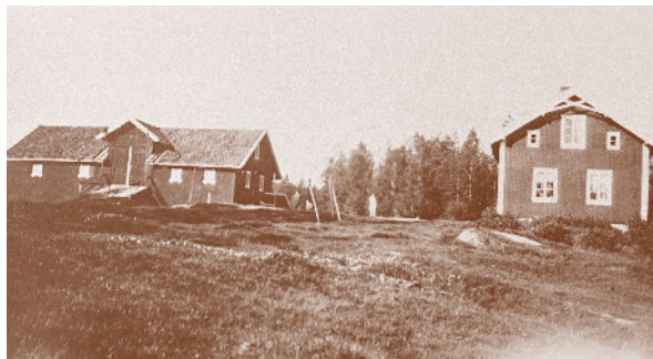
Hyttenga 1930. Husmannsplass under Siggerud gård.