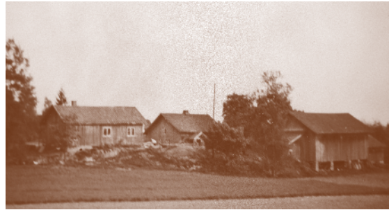
Furu 1954. Husmannsplass under østre Mørk gård.