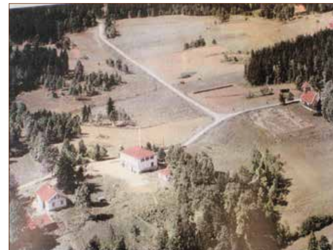
Siggerud sentrum 1954. I 1955 bygde kommuneskogene sitt administrasjonsbygg der hesjene står nedenfor kirken.

De siste 20–30 årene har friluftsliv og natur vært det økonomisk bærende grunnlag i forvaltningen. Hvilken skjebne kommuneskogenes administrasjonsbygg vil møte i fremtiden, gjenstår å se.