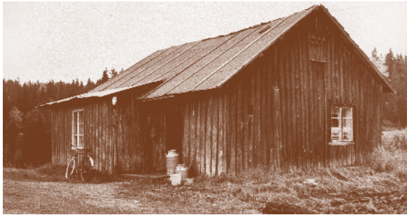
Bråten 1979, innerst i Sloraveien på Langhus. Husmannsplass under Vevelstad gård.

Gjennom 1800-tallet var det registrert rundt 125 husmannsplasser i Ski/Langhus-området. Nedenfor er noen bildeeksempler.