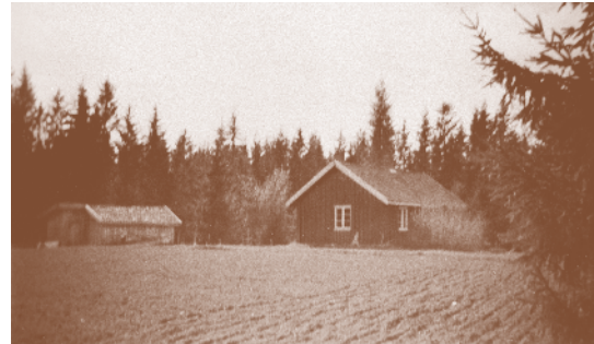
Bernhus 1957. Husmannsplass under Gryteland.