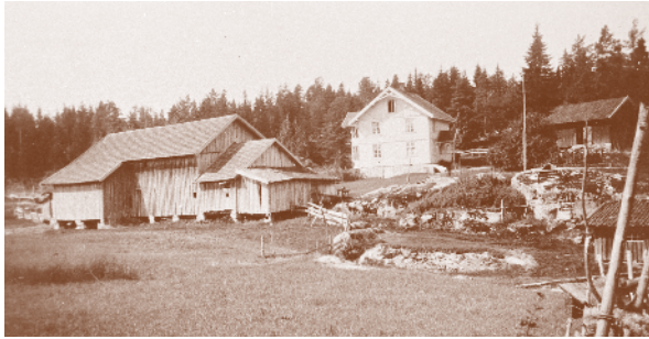
Barli 1932. Husmannsplass under Siggerud.

Gjennom 1800-tallet var det registrert rundt regnet 60 husmannsplasser i Gjedsjø/Siggerud-området. Nedenfor er noen bildeeksemplere.