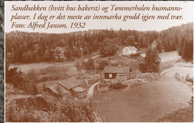
Sandbakken (hvitt hus bakerst) og Tømmerholen husmannsplasser. I dag er det meste av innmarka grodd igjen med trær.