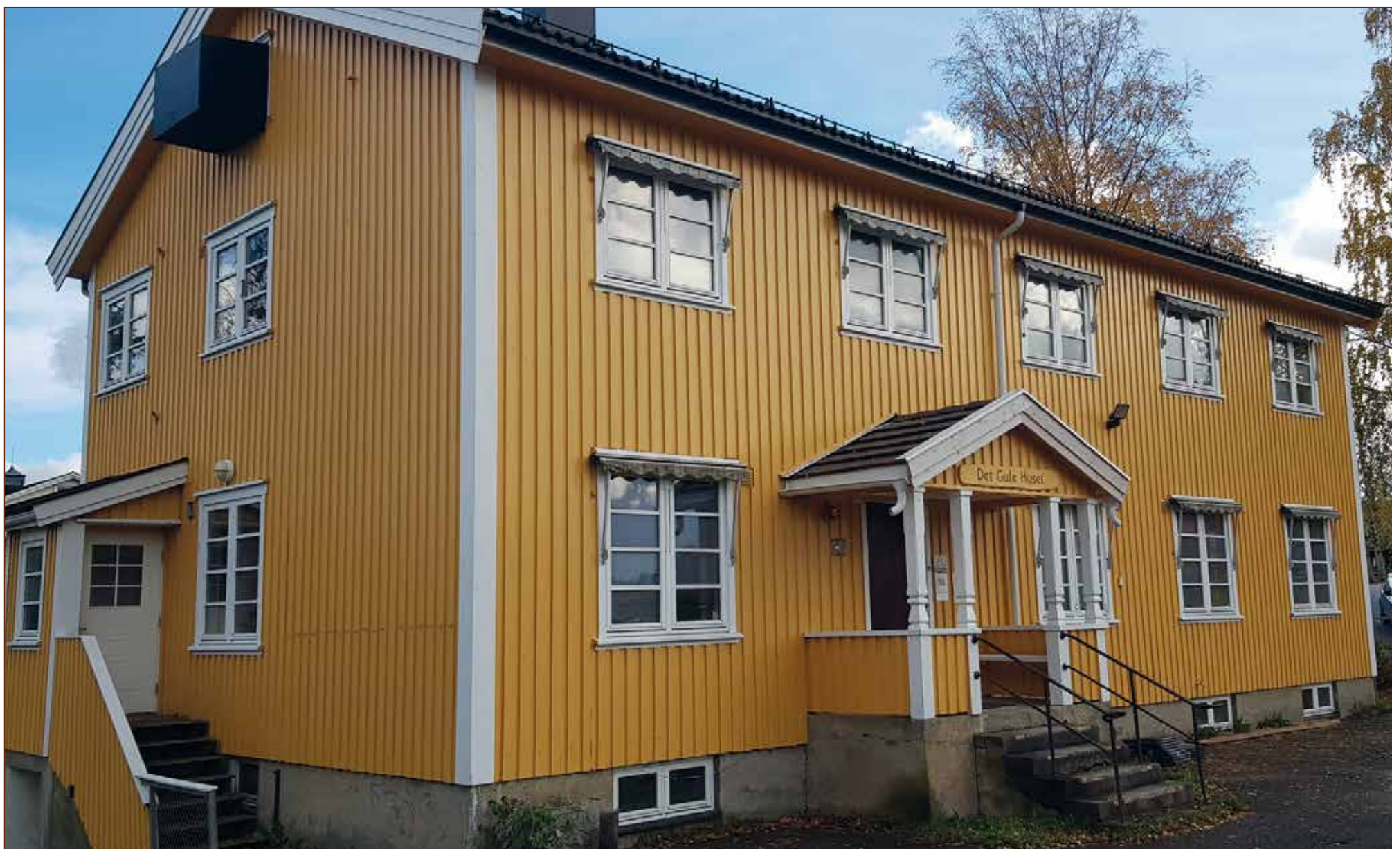
«Det gule huset» – det nye galleri- og kunstsenter i Kråkstad.