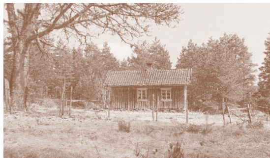
Strevoppbråtan 1950. Husmannsplass under Strevop.