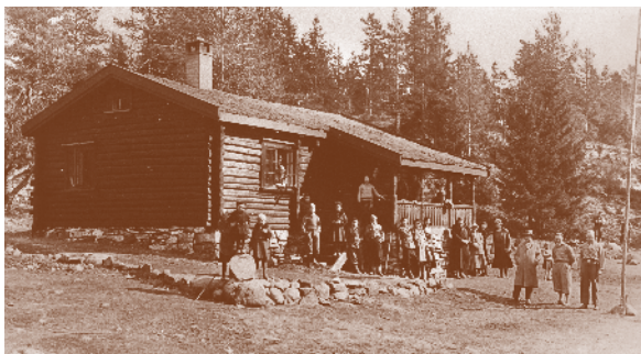
Sterkerud 1932. Selve plassen var husmannsplass under Karlsruud gård, mens speiderhytta ble reist i 1932. Bildet er fra åpningen av hytta.