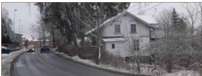
Solvang i desember 2021.