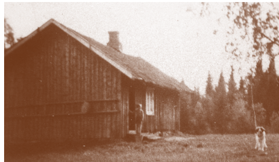
Tyrigrava 1954. Husmannsplass under Rud. Ukjent guttunge på trappa.