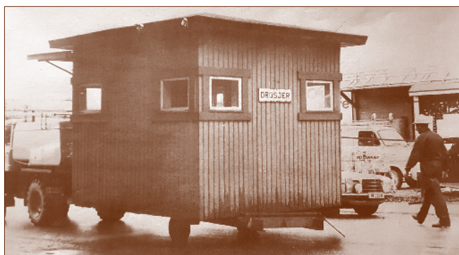
Siste reis for Pokerbråtan

Forholdet mellom sjåførene var veldig kollegialt og mange spøkefulle historier er fortalt. Ved en anledning ble en av sjåførene, som hadde kjørt hele natten, malt med store røde flekker i ansiktet mens han sov. Han ble purret da han fikk tur, og kjørte en familie til Langhus. Han fortalte at folkene i baksetet så nervøse og redde ut.