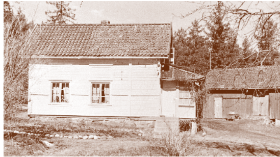
Bollerud/Kringsjø 1957. Husmannsplass under Hebekk gård.