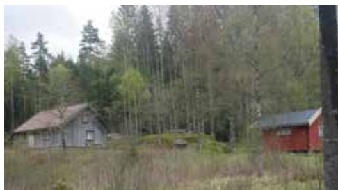
Hjellsbråten 2021. Tidligere husmannsplass under Hjell.

Noen tidligere husmannsplasser er pusset opp, og brukes i dag som feriested, for eksempel Hjellsbråten i Kråkstad. Møllerenga på Langhus, og Tømmerholen ved Sandbakken, er eksempler på tidligere husmannsplasser som kommunen har kjøpt, med sikte på tilrettelegging for friluftslivet. På flere av de gamle husmannstufte kan vi i dag finne en eller annen forenings-/lagshytte, for eksempel speiderhytta på Sterkerud, og Ski jeger- og fiskeforening på Årlia, og Ski Golfklubb på Smerta.