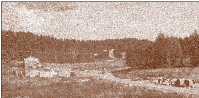
Siggerud sentrum 1967 – Bare kirka og Vevelstadveien 114 er bygd