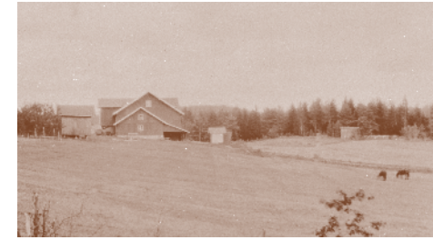
Helgestad 1924. Tidligere husmannsplass under Grøstad. Eget bruk fra 1805.

Utover 1900-tallet ble mange av husmannsplassene stående ubebodde, og de forfalt raskt – i dag står det tilbake kanskje bare en enkel grunnmur, et forfallent hus, eller det er ingenting igjen (hele plassen er gjengrodd, eller er av sikkerhetshensyn brent ned).