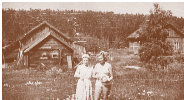
Brubråten 1949. Husmannsplass under Bru. Damene på bildet er ukjente.