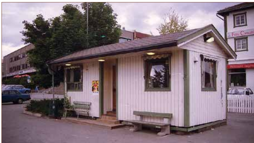
Ny drosjebu foran Arnies Pub

Etterhvert ble bua for liten og ny bu ble plassert utenfor Arnies Pub, der hvor Egon er i dag. Etter noen år ble det bygget en ny hvilebu der hvor Pokerbråtan stod. I dag er den også fjernet, og drosjene står oppstilt vest for Ski stasjon.