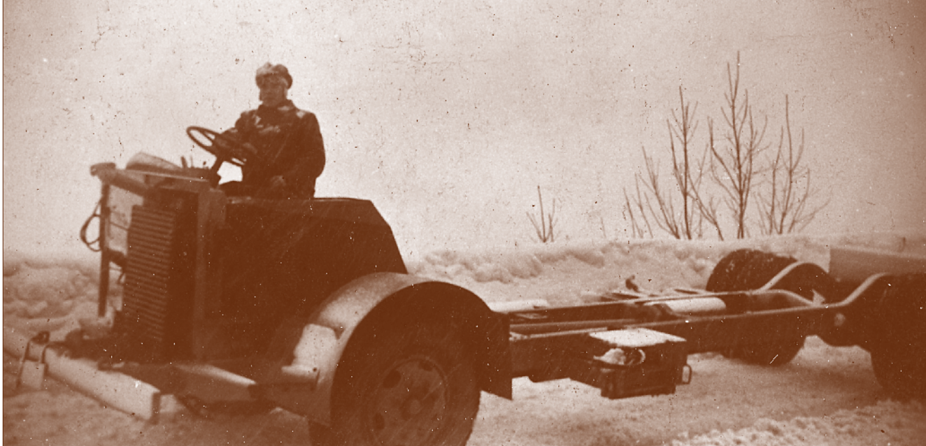
Kald fornøyelse i snøvær

Bussen ble buss nr. 5, og gikk sine tre turer hver dag til og fra Oslo via Siggerud og Sværsvann.