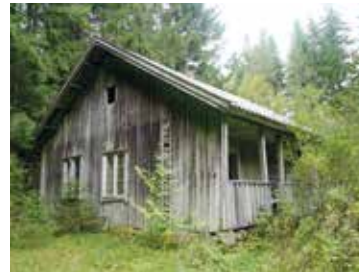
Snekkerstua 2017. Tidligere husmannsplass under Gjedsjø.