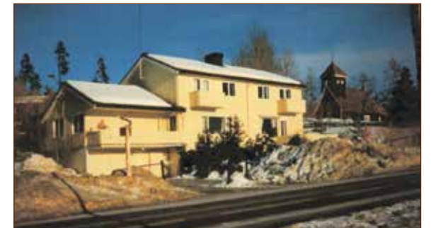
1992. Vevelstadveien 114