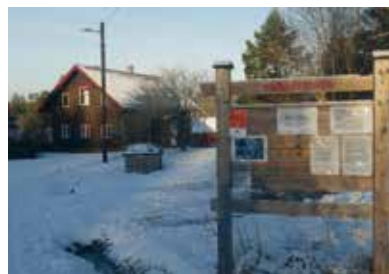
Møllerenga 2021. Tidligere husmannsplass under Vevelstad.