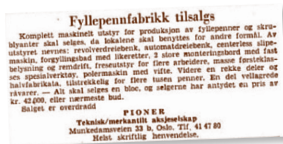
Over: Skjermdump av annonse i Aftenposten 10.11.1954 Øverst til høyre: Siggerudveien 815