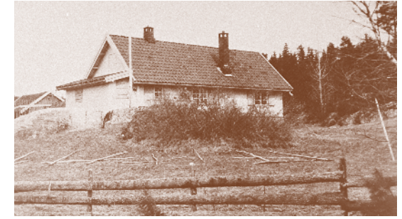
Holen 1930. Husmannsplass under Bru.