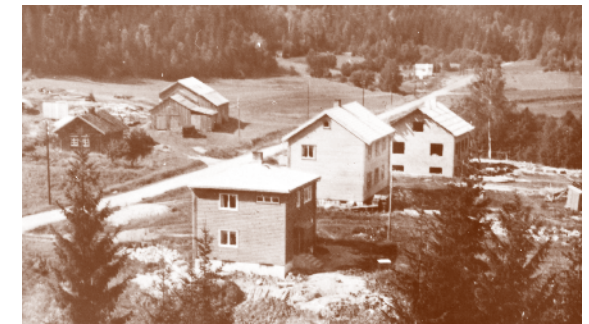
Sprettopp i Sloraveien på Langhus 1953. Husmannsplass under Vevelstad gård.