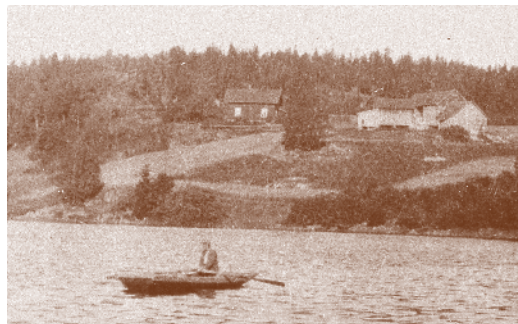
Slora 1935. Husmannsplass under Skjegstad. I båten Rasmus Hjelmen.