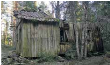
Strevoppbråtan 2020. Tidligere husmannsplass under Strevop.

Utover 1900-tallet ble mange av husmannsplassene stående ubebodde, og de forfalt raskt – i dag står det tilbake kanskje bare en enkel grunnmur, et forfallent hus, eller det er ingenting igjen (hele plassen er gjengrodd, eller er av sikkerhetshensyn brent ned).