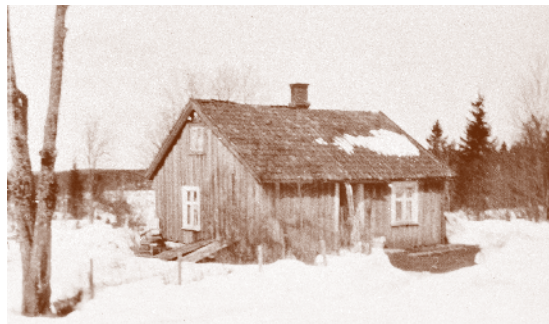
Smerta 1930. Husmannsplass under Bekkevar