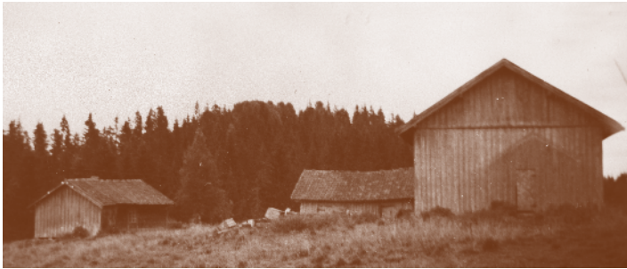
Dammen 1954. Husmannsplass under Jaer.

Gjennom 1800-tallet var det registrert rundt regnet 130 husmannsplasser i Kråkstad/Skotbu-området. Nedenfor er noen bildeeksempler.