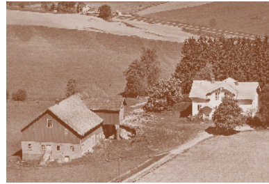
Slottet 1959. Tidligere husmannsplass under nedre Asper gård. Eget bruk i 1831.