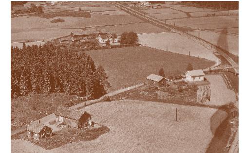
Titut 1959. Husmannsplass under nordre Løken gård. Til høyre for Titut er Hundeøl og Kjeppestadbrua.