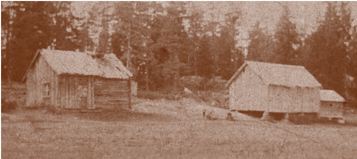
Libytta 1895. Husmannsplass under Li. Husene er nå revet.