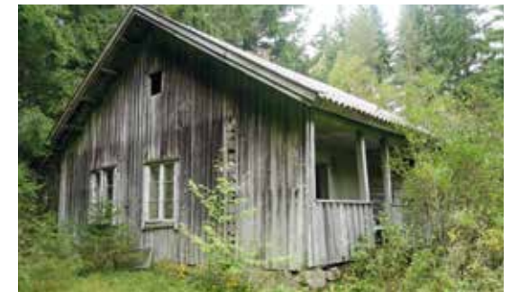
Snekkerstua/Rustadbråten 2017. Husmannsplass under Gjedsjø gård (og før dette under Rustad i Enebakk).