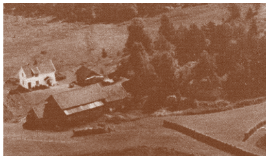
Brokkenhus 1951. Husmannsplass under Syverud.