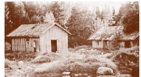
Bua/Braanen 1960. Husmannsplass under Tallaksrud.