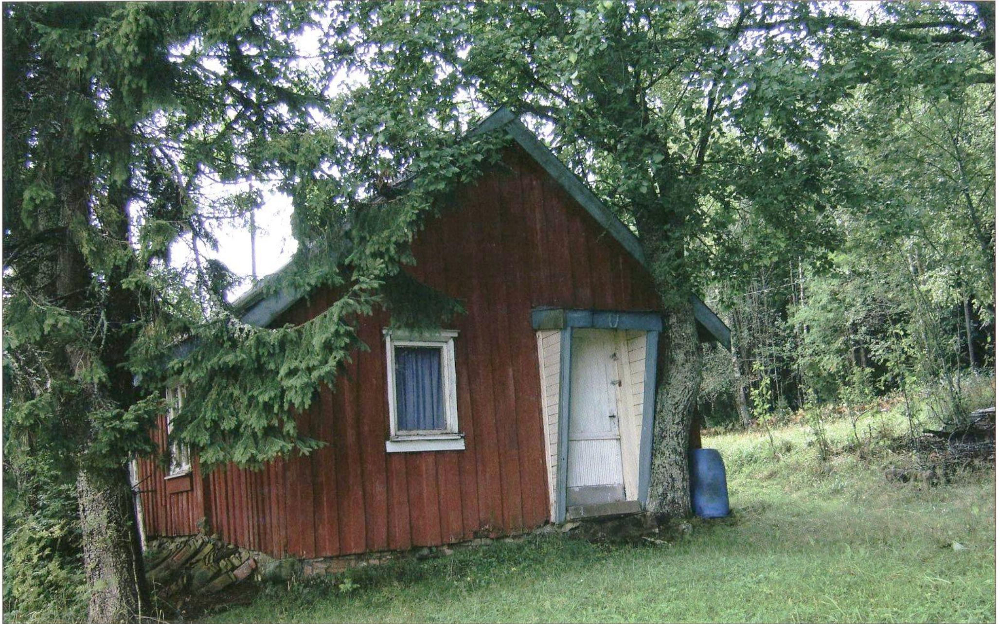
Husmannsplassen på bildet tilhører Bjerke Nordre i Kråkstad. Bildet er tatt i 2014. Bygningen er godt bevart og gir et godt uttrykk for hvordan den var da den siste husmannen bodde her. M. Østlid kaller husmannsplassen Bråtan. Den ble ryddet inne i skogen, men i dag ligger den i utkanten av et kornområde. Den siste «mannsalder» har plassen båret navnet Bjerkehytta.