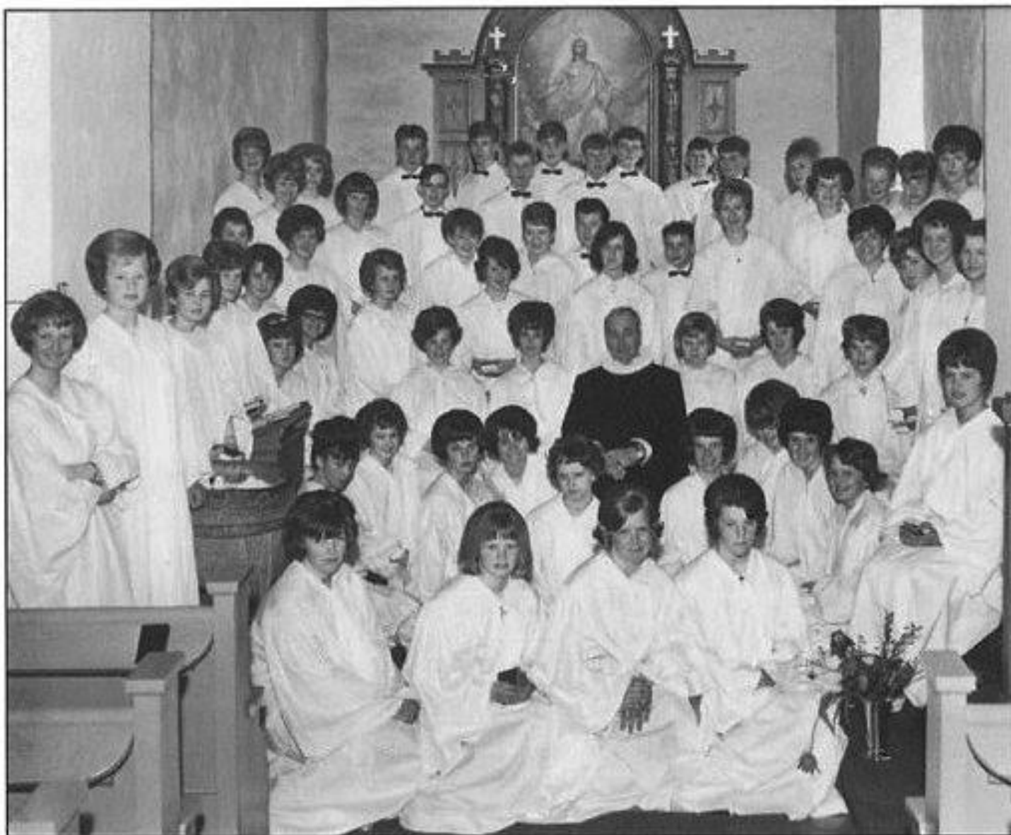
Den 2. mai 1965 ble følgende konfirmert i Ski kirke: