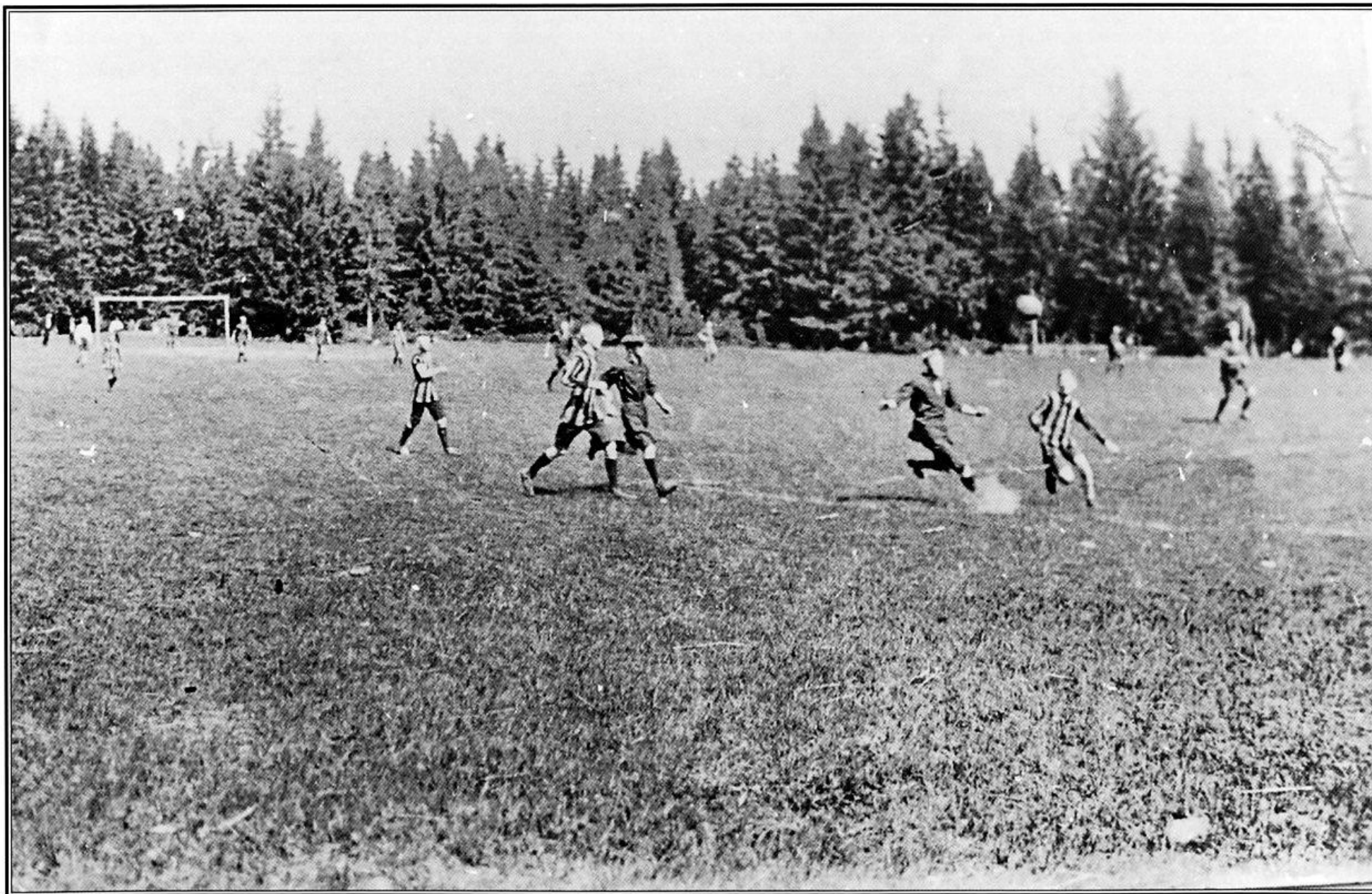
Fotballkamp på Bernhussetta ca. 1911. Lagene er trolig Kråkstad IL mot Mercantil-Trygg fra Kristiania.