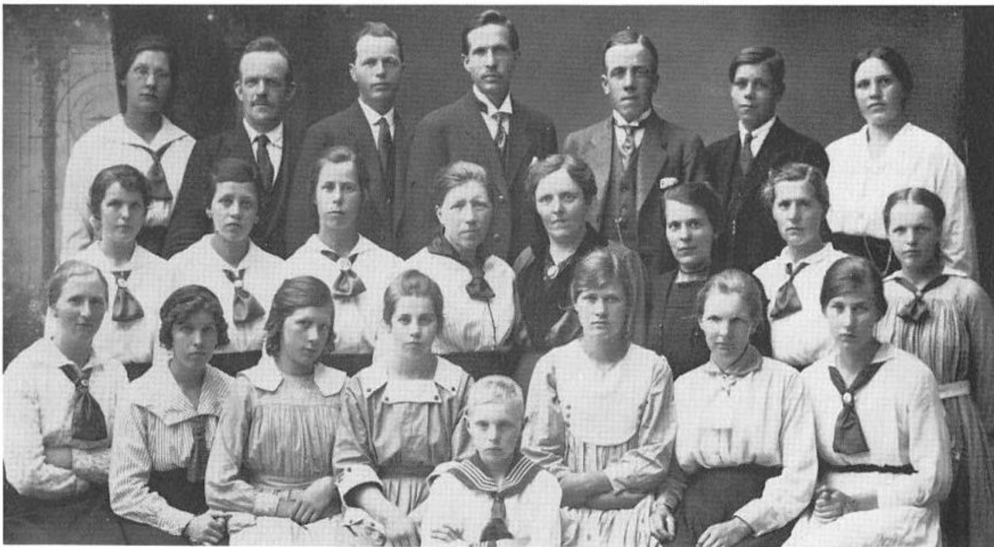
Navnene finner du på side 2 i kalenderen.