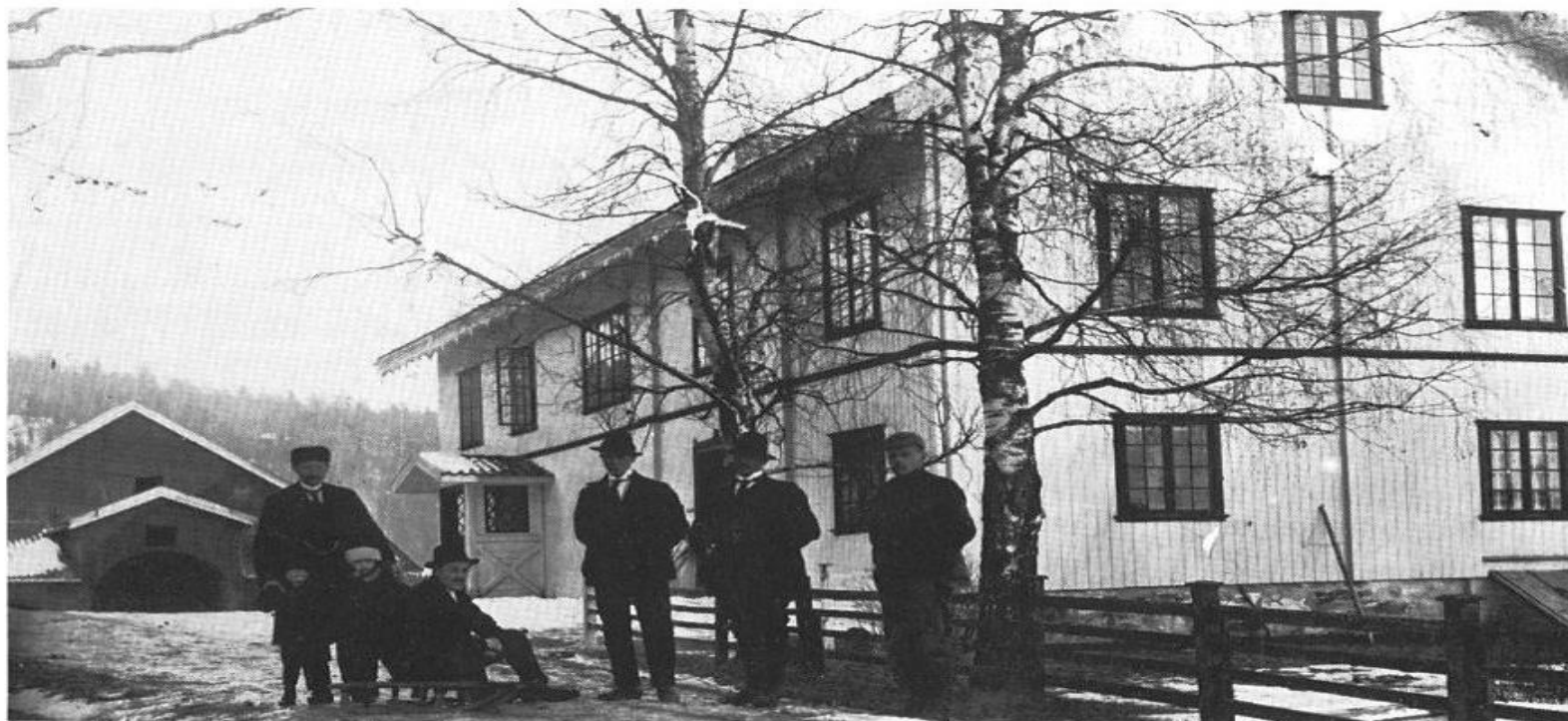
KROKHOL GÅRD, 1918

Programmet julaften var såvidt tettpakket, at jeg tror vi ikke gikk rundt juletreet før dagen etter. Det var tid å gå til køys. Alle takket for julegavene, for all deilig mat – og for julekvelden.