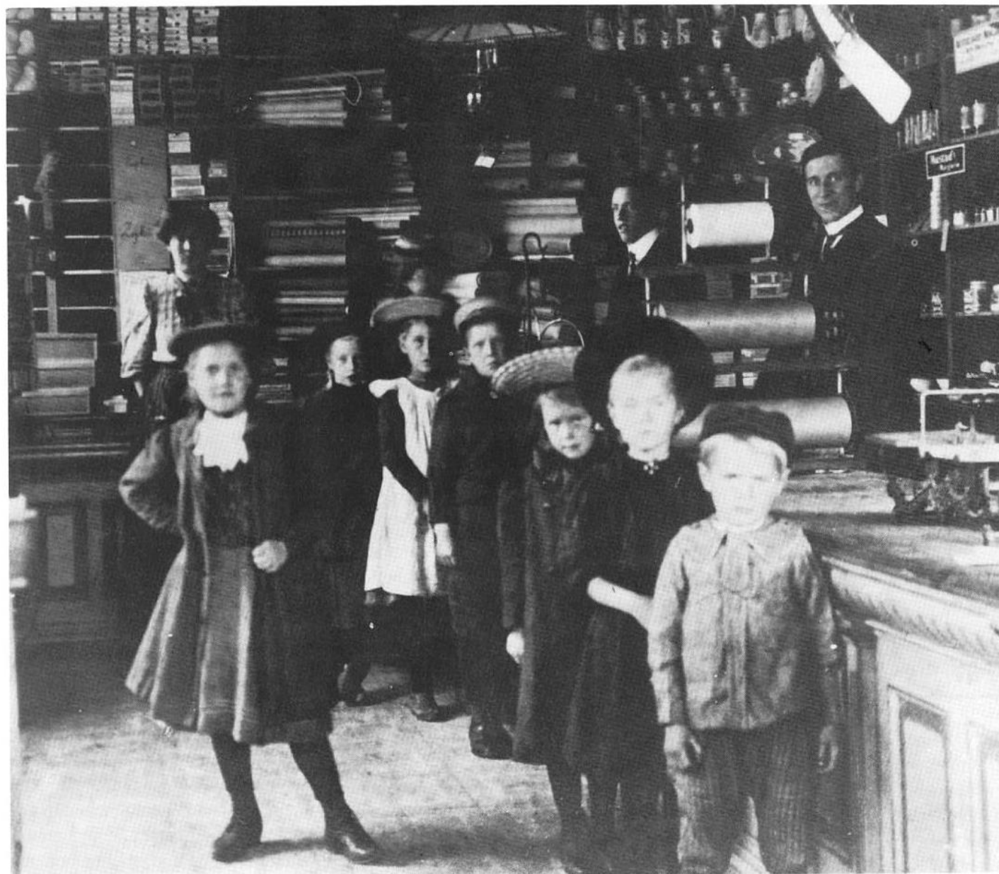
Interiør fra Refsum butikk. Kanskje fra 1890-årene, da forretningen lå på Sanderborg.

I bakgården sto en lang hesterekke, hvor hestene sto tett, særlig på lørdagene. Da møt-