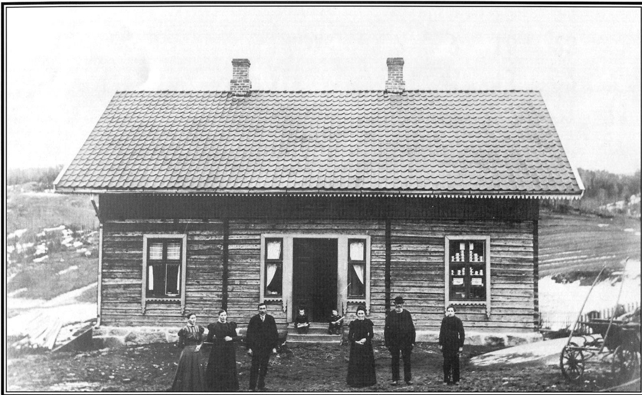
Landhandelen på Kullebund gård ved Siggerudveien mellom Bru og Siggerud ble etablert på 1870-tallet og må ha vært blant de første i landet. Landhandelen på Kullebund var i drift fram til 1932. Bildet er fra 1915.