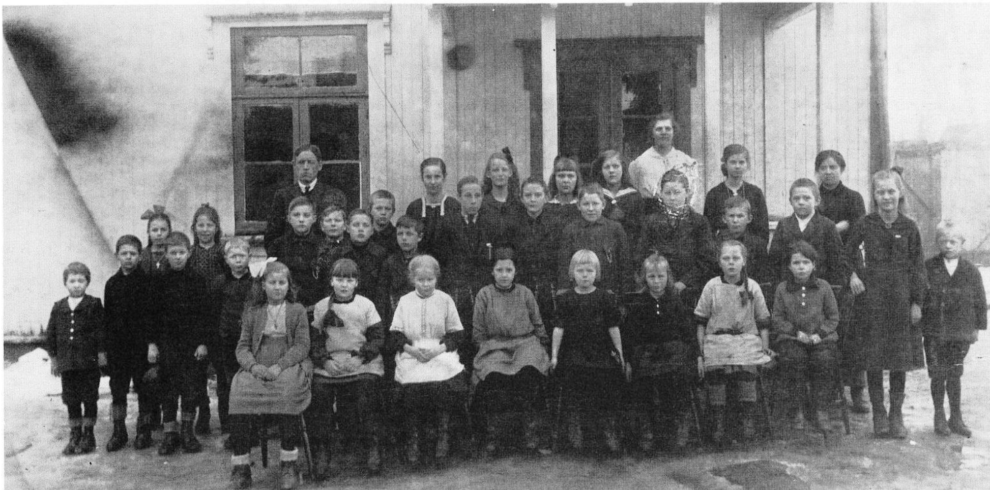
Bildet er tatt i 1919.