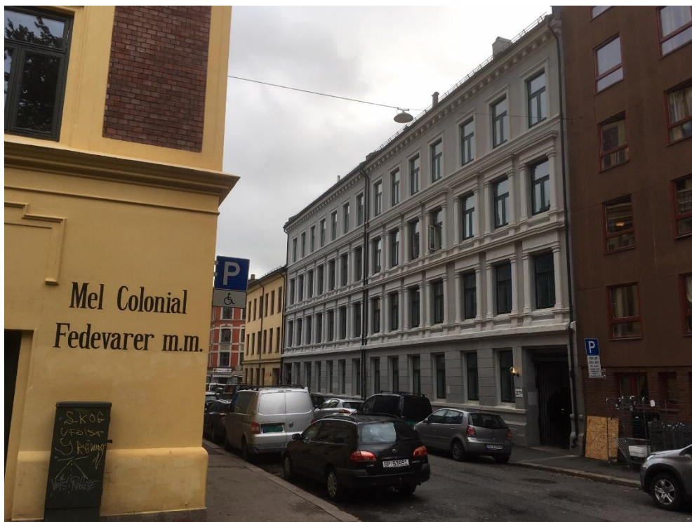
Foto fra hjørnet av Rudolf Nilsens plass tatt i 2020. En ser bortover Heimdalsgata i retning Motzfeldtsgata. Heimdalsgata 27 B er den første grå gården til høyre der familien Østerud bodde i 2. etasje mot gata og familien Gran i bakgården. Neste er nr. 27 C, Klevensgården. Den gule gården bortenfor der igjen er Motzfeldtsgate 18 der min mor og tante bodde i årene før og under krigen.