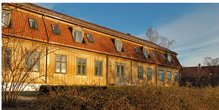
Tøyen hovedgård. Fasade mot sør.

En av perlene i EGT-området er Botanisk hage med Tøyen hovedgård. Denne utgaven av Historiebrev er viet Tøyen som område, og gården er sentral i det grønne Tøyen.