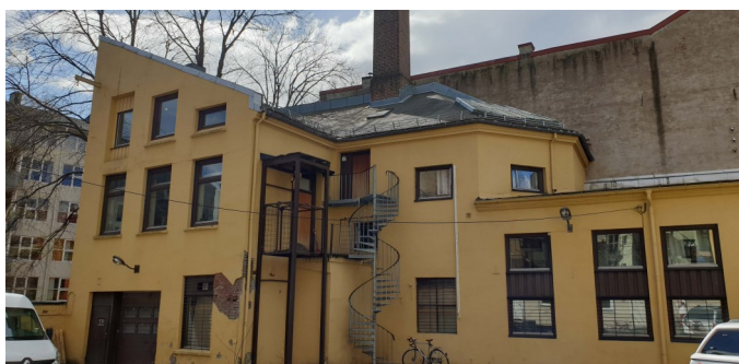
Smedgata 25, april 2020.

Her er det saker i EGT-området som har pågått over flere år og det kommer stadig nye til.