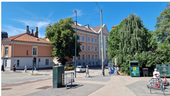
Tøyen skole.

Eiendommen lå under Tøyen hovedgård - en av landets eldste, som en gang tilhørte Nonneseter kloster. Navnet kommer fra betegnelsen Tadvin eller Todvin - som var engelsk for beitemark. Tøyen hovedgård ble