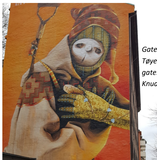
Gatekunst på Tøyen. Jens Bjelkes gate.

Som følge av utbyggingen av Tøyen Torg og området rundt har gradvis en større del av området blitt omtalt som Tøyen. Det som tidligere var nedre Kampen er i dag en del av Tøyen. Tøyen har «spist» seg østover. Tidligere lå for eksempel Kampen postkontor i Hagegata ved siden av baker Nordby og Kampen fiskerforretning lå der baker Norby kom inn. Den eldre befolkning regner seg nok fortsatt å bo på Kampen. Det er greit. Vi kan benytte begge.