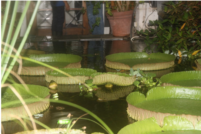
Victoriahuset Botanisk hage. Victoria –vannliljen.