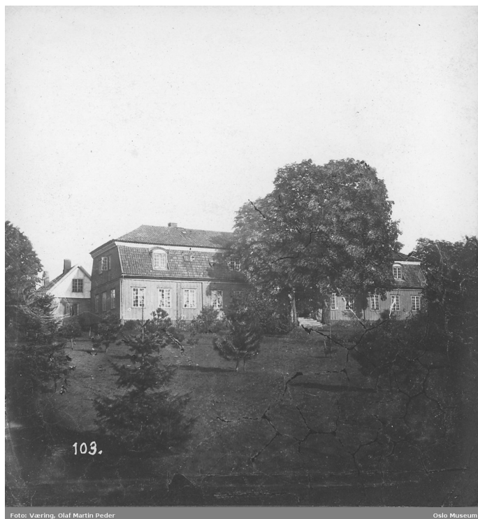
Tøyen hovedgård. Oslo Museum. Foto: Olaf Martin Peder Væring, ca. 1875.

Gården var kloster- og kirkegods helt fram til 1617. Fra da skal gården ha tilhørt lagmann Bertil Mule (Hedmark). Den første beskrivelsen av bygninger på Tøyen hovedgård er fra 1721. Det daværende våningshuset var trefløyet slik som i dag.