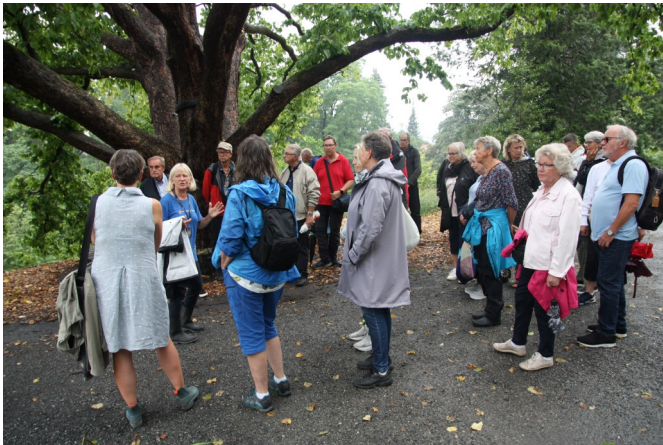
Historielagets omvisning i Botanisk hage 14.august 2022.

Midt på vinteren er det bare i veksthusene vi finner planter i blomst. I Victoriahuset finner vi den vakre Victoriavannliljen . Den er spektakulær. Det er en vannplante med store sirkelformede blader som flyter på vannoverflaten. Bladene kan bære vekten av et lite barn. Den blomstrer hele året med hvite til rosa blomster. Her er også mange arter i orkidéfamilien med et fantastisk mangfold av farger og utforming av blomsten. Her finnes også mange eksotiske planter med nyttevekster som vi kjenner og bruker hver dag - f. eks. Kaffebusken med små røde frukter og Kakao-treet med avlange store frukter. I Palmehuset står et utvalg av palmer og nytteplanter, som sitrusfrukter , oliven , fiken og eukalyptus . Lett gjenkjennelig er Paradisfuglblomsten med oransje og blå blomster som i helhet kan minne om hodet på en fugl. Den vakre Kameliaen blomstrer med store blodrøde blomster. I ørkenrommet finnes ulike planter i kaktusfamilien og den nyttige og populære Aloe vera . Det er gode skilter med navn så det er mulig å finne fram i disse veksthusene, men det tar litt tid. Hagen fylte 200 år i 2014.