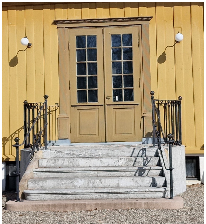
Trapp mot syd med Wilhelm Willemsens initialer.

Kilder: Liv Borgen: Botanisk Hage 1814-2014, Wikipedia, Lokalhistoriewiki.no, Oslo Byleksikon, UiO, Francis Bull: Tradisjoner og minner, St. Halvard 1968