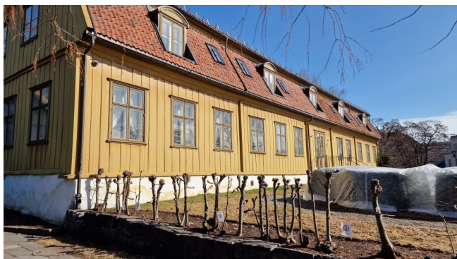
Tøyen hovedgård en vårdag 2023.