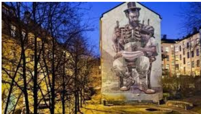
Gatekunst Schübelers gate.