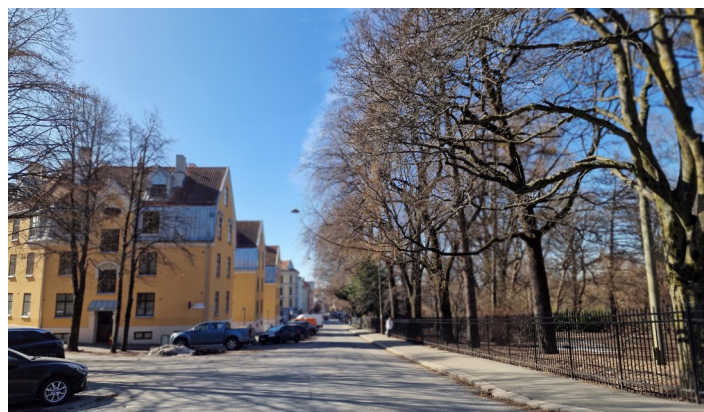
Enden av Tøyengata ved Tøyengata 47, tegnet av arkitekt Rivalentz.

Hagegata og Tøyengata var som østkantens Pilestredet som en trase` fra nordøst ned mot sentrum av Oslo. Her var travel handelsvirksomhet og trafikk, med biler og trikkelinje. Kampetrikken fra Brinken til sentrum gikk i gatene. Nå er trafikkbildet endret. Med etableringen av Tøyen Torg og Tøyen T-banestasjon er biltrafikken redusert og trikken er bor-