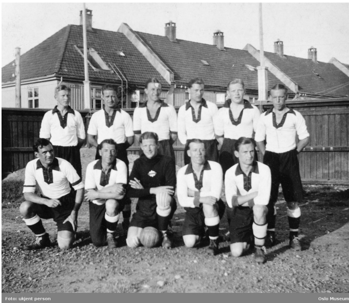
Sterling fotballag ca. 1930.

Fotball topper lista over populære idretter i vårt område. Ved siden av fotball er også de andre lagidrettene populære. Tennis og bridge er også med, min vi finner dem lenger ned på lista.