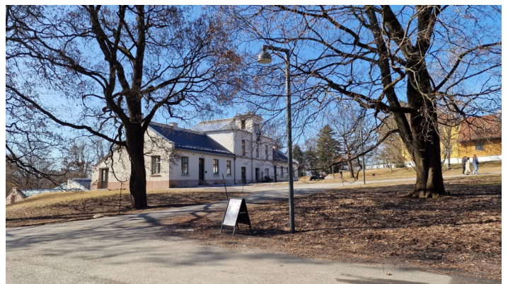
Palmehuset i Botanisk hage.

ut sin eksotiske duft fra slutten av mars og utover i april-mai. Den parfymere både hagen og hele Tøyen-området. Den vakre Kirsebær-alleen fra porten i Sars`gate springer ut i midten av mai. Lommetørkle-treet blomstrer i slutten av mai. Det står innenfor øvre port i Monrads gate. De to hvite bladene som omgir blomsterstanden lyser opp og svever som duer - eller vifter som lommetørklær i vinden. Hagens vårbloster dukker etterhvert opp i alle bed og plener. Tidlig ute er Vårkrokus , Snøkløkker , Russeblåstjerne og Lerkespore , som danner sammenhengende blomstertepper. Hjemlige vårbloster, som Kubjelle , Hvitveis , Gulveis og Blåveis lyser opp. Litt senere er purpurrøde matter av Rødsildre en av vårens skjønneste blomster. Deretter eksploderer