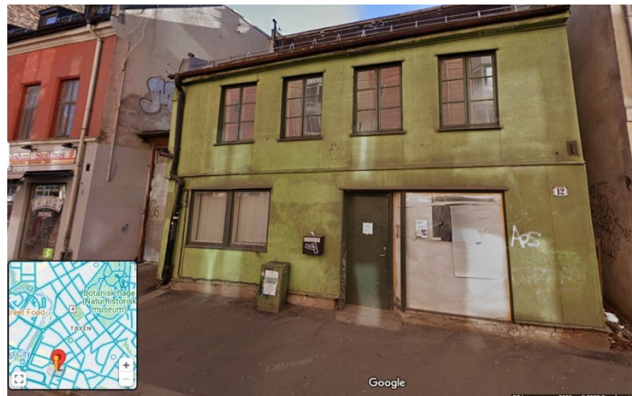
Tøyenbekken 12. Google.

I tillegg har vi selvfølgelig det gamle Munch-museet og ikke minst hva skjer med Botsfengselet.