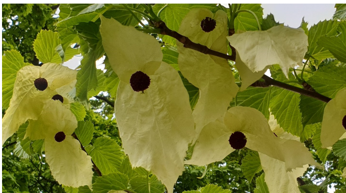
Lommetørkleetreet i Botanisk hage.

En oase midt i vårt område. «Alle» i EGT har vel vært der, en eller flere ganger. Det nærmer seg den hektiske og omfattende blomstrings-sesongen, som er i mai og juni. Botanisk hage på Tøyen er vakker året rundt. Våren kommer tidlig. Noen trær blomstrer allerede i januar, andre i februar og mars/april. De fleste plantene eksploderer i mai, og noen så tidlig som i april. Det er alltid en glede å besøke hagen. Først ute er Virginiatrollhassel som blomstrer allerede i januar. Det er en busk fra Nord-Kina, Vårkorsved , er også tidlig ute. Den kan blomstre allerede i