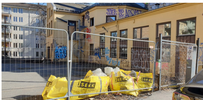
Smedgata 25, april 2023.

Oslo, 19. april 2023/Karin Arnesen, nestleder