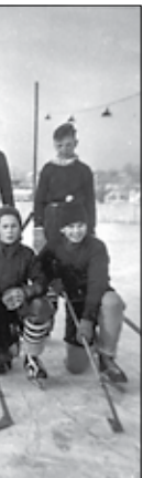
et for Furuset IF på 1950-tallet (i